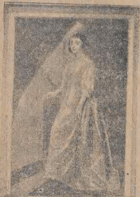
Obraz Van Dycka (1599—1641), przedstawiający Marię, w. ks. Buckingham, małżonkę Jakóba Stuarta de Richmond.