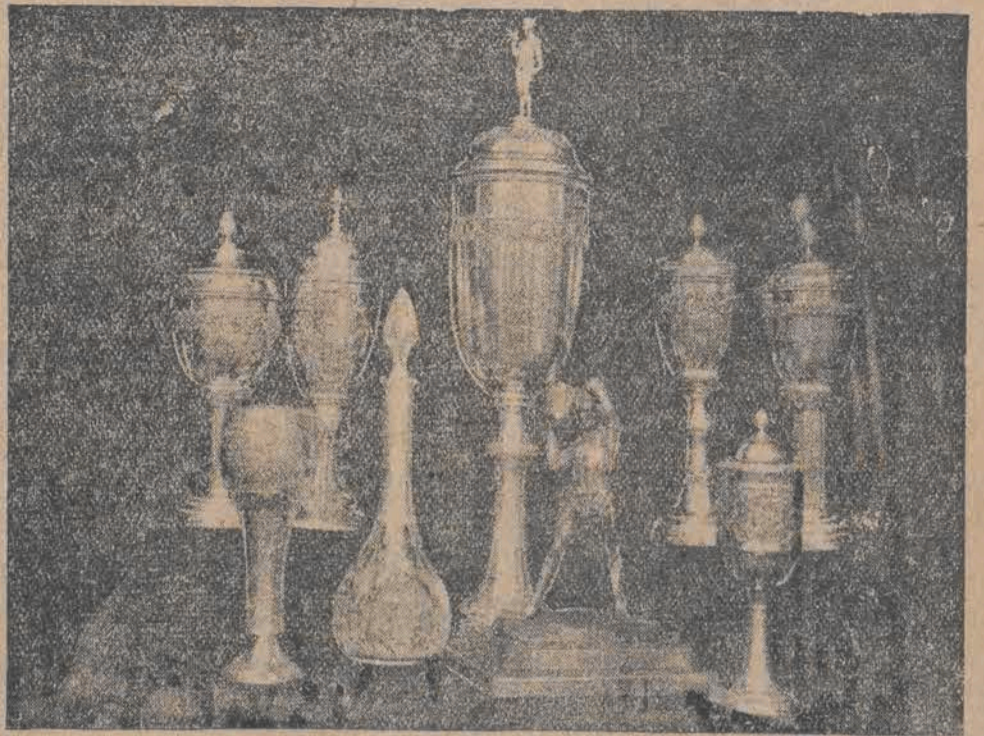
Mało które z naszych fowarzystw wioślarskich może się poszczycić takimi pięknymi pamiątkami pracy, jak Klub Wioślarski z r. 1904 w Poznaniu. Ilustracja nasza przedstawia te piękne nagrody, które rychły zwycięzcy były udziałem pracy i wysiłków wioślarzy Klubu Wioślarskiego z r. 1904 w Poznaniu.

Możemy stąd wywnioskować także i dla nas naukę, a mianowicie olimpijczycy polscy powinni swoje przygotowanie raczej skierować w kierunku treningu, niż startowania w licznych w miesiącu styczniu zawodach, a wtedy osiągną oni swoją najwyższą formę podczas Igrzysk w konkurencji, z najlepszymi narciarzami świata.