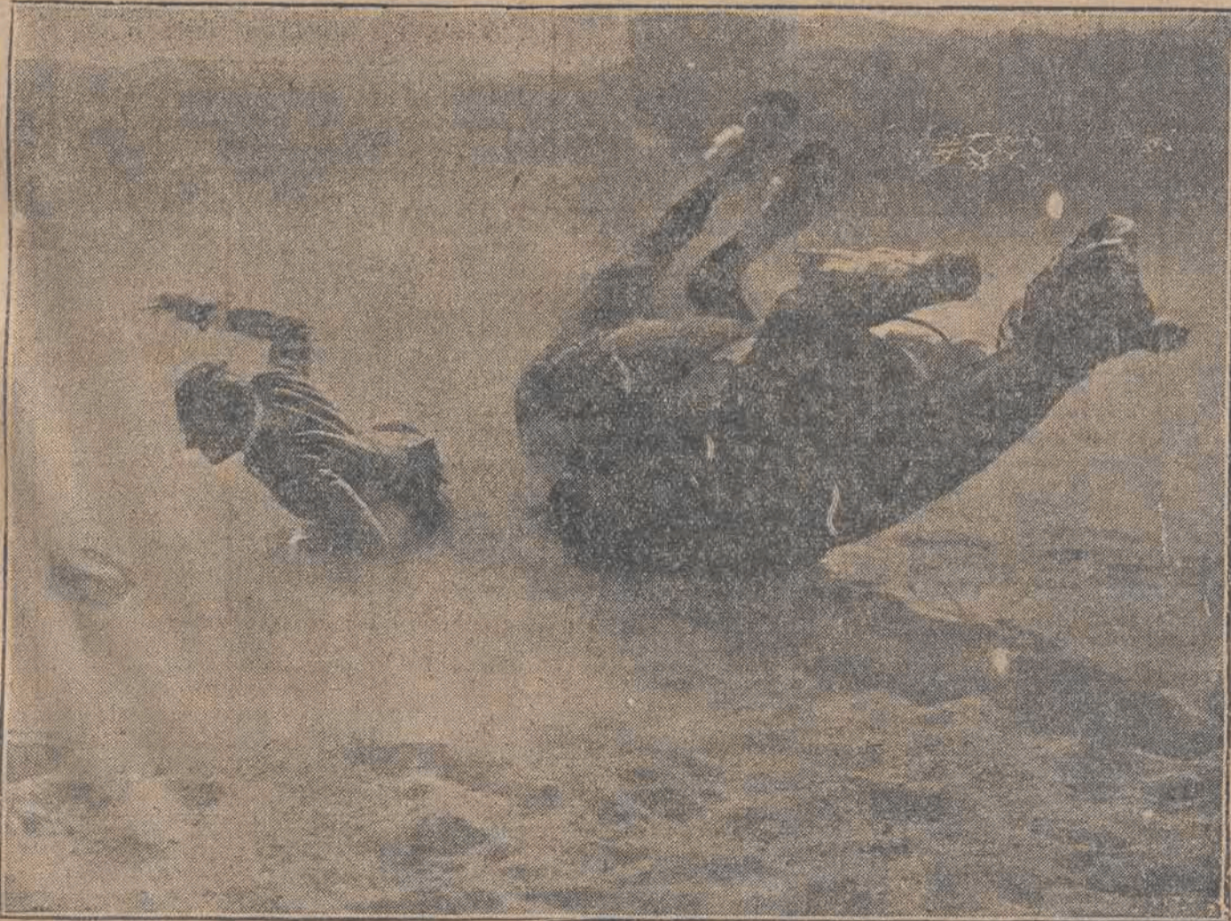
Ciekawa fotografia: upadku z konia ucznia szkoły wojskowej kawalerskiej w Tor Quinto (we Włoszech).