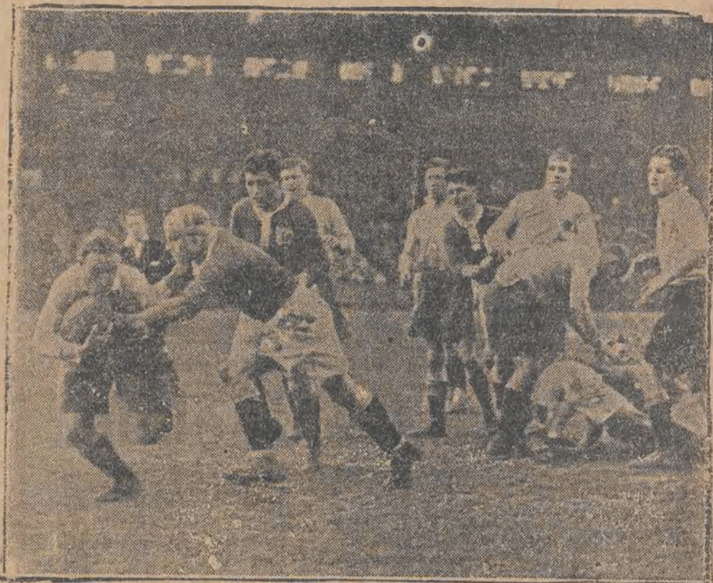
Ciekawe zdjęcie z meczu „rugby” w Paryżu.

miera Partla, uchwaliła wyasygnować 600 tysięcy złotych na potrzeby sportu i wychowania fizycznego