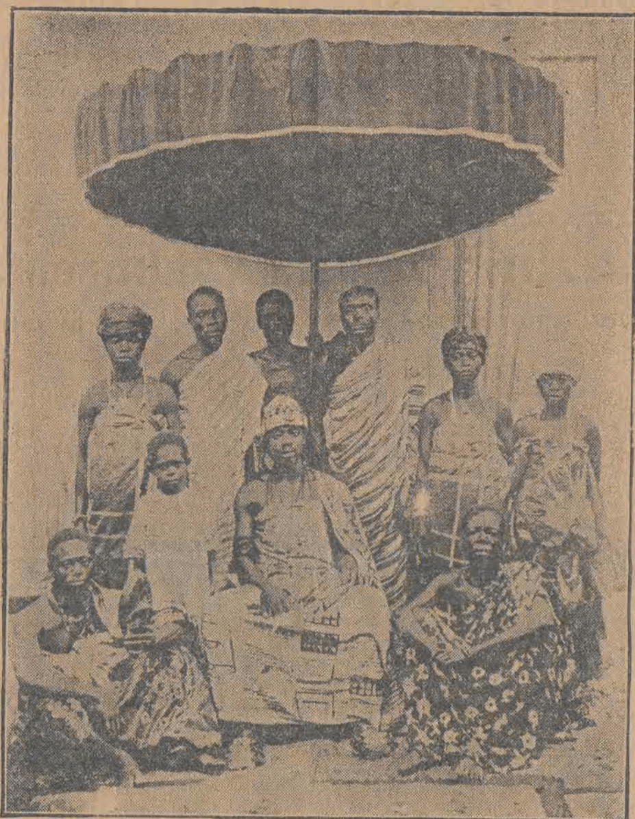
Król murzyński Aschanti, władca t. z. „Złotego Brzegu” w Afryce wraz ze swoim dworem.