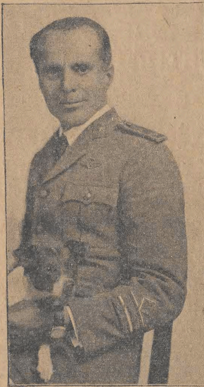
General Nobile, najsłynniejszy lotnik włoski.