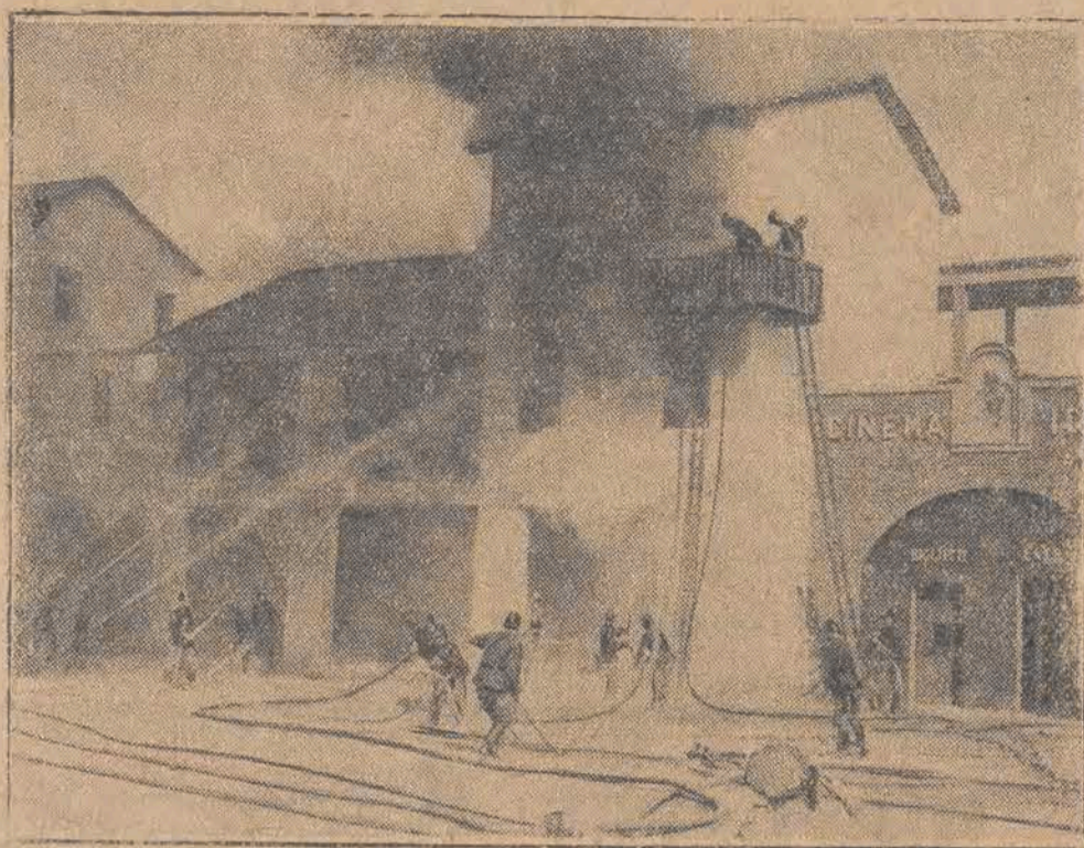
2. zawodów międzynarodowych straży pożarnych w Turynie. Gaszenie płonącego budynku.

— Jeden z nich regularnej konsumpcji wódki, drugi — kompletnej abstynencji.