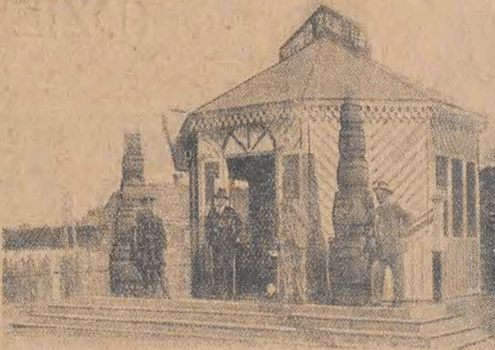
Dnia 1 września otwarta została w Łucku pierwsza Wystawa Wołyńska, obrazująca całą wytwórczość Wołynia. U góry—oryginalna brama przez którą wchodzi się na wystawę, u dołu—pawilon czechów wołyńskich.