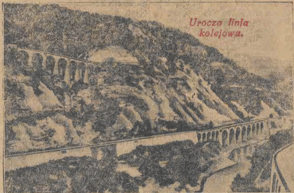
Uroczą linią kolejową.

Na Riwierze oddano w tych dniach uroczyste, w obecności francuskiego ministra robót publicznych, do użytku publicznego nową linię kolejową, prowadzącą z Francji do Włoch.