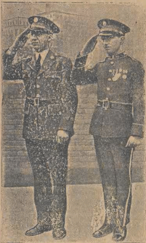
W armii Stanów Zjednoczonych zostały obecnie szare uniformy połowe zastąpione przez zwykłe niebieskie mundury.