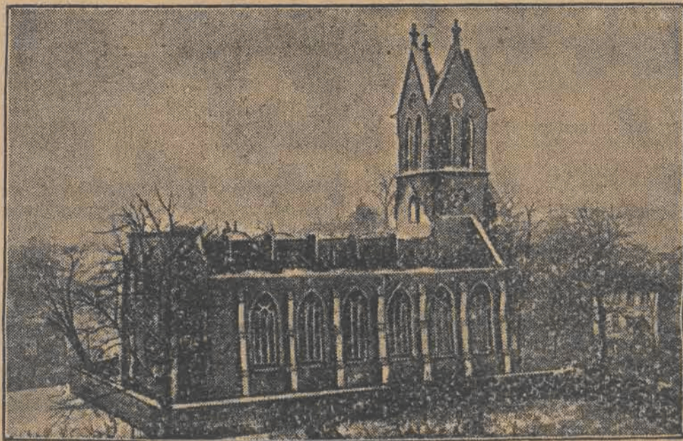
Kościół katolicki w miasteczku Moers (Nadrenja) padł niedawno ofiarą ognia.