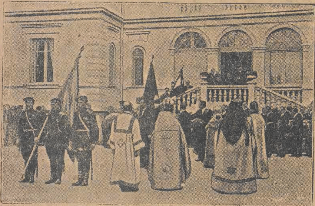
Pogrzeb Mikołaja Mikołajewicza odbył się w Cannes z zachowaniem wszelkich ceremoniałów kościoła prawosławnego oraz dworskiej pompy bylej — cesarskiej Rosji...