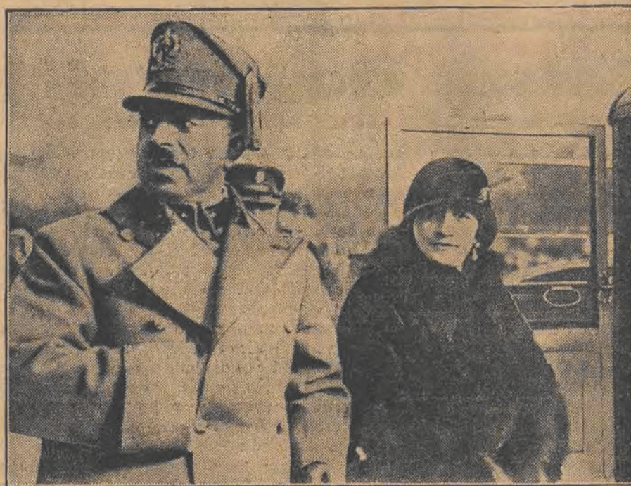
Zdetronizowany król AMANULLAH z małżonką SURAJĄ.

W fabryce pierników Gorguli wybuchł z nieznanej przyczyny pożar, który objął wszystkie magazyny fabryczne. Miejscowa straż ogniowa i wojsko walczyły z żywiołem około 12 godzin, przyczem jeden strażak uległ zranieniu.