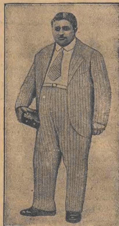
INAYAT-ULLAH, brat Amanullaha, nowy król Afganistanu.