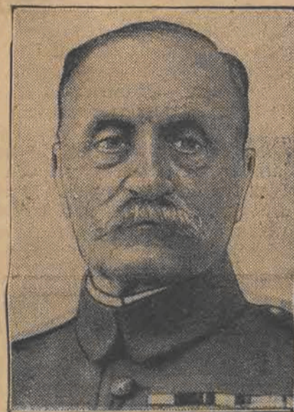
MARSZAŁEK FOCH, pogromca mocarstw centralnych, ciężko zachorował na serce. Istnieje obawa o jego życie.