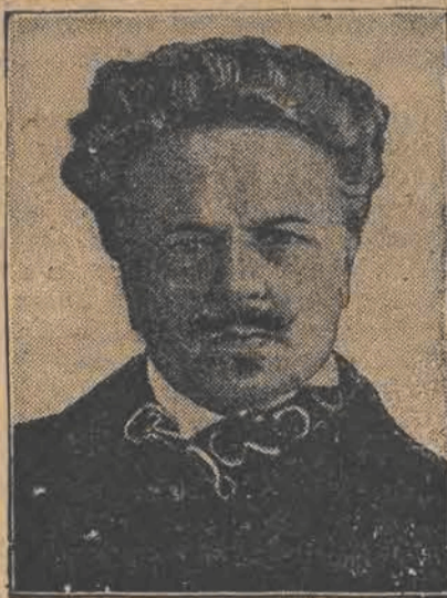
AUGUST STRINDBERG. 80 lat mija w dniu 22-go grudnia od dnia urodzin wielkiego twórcy i pioniera naturalizmu w literaturze współczesnej. Strindberg zmarł w r. 1912.

Prenumerata: W Łodzi 4.00 miesięcznie. — Zamiejscowe 5 zł. miesięcznie. — Zagranicą 7 złotych miesięcznie. Odnoszenie do domów 40 groszy. Ogłoszenia: ZWYCZAJNE: 10 gr. za wiersz millimetry (na stronie 10-szpalt.) W TEKŚCIE: 40 gr. za wiersz millimetry. (na stronie 4-szpalt.) NEKROLOGI: 30 gr. za wiersz mil. (na str. 4-szp.). Zaręcz. i zaślub. po tekście 10 zł. Za miejsce zastrzeżone specjalna dopłata. Zamiejscowe o 50 proc. zagraniczne o 100 proc. drożej. Za terminowy druk ogłoszeń administracja nie odpowiada. Drobne 12 groszy. — Najmniejsze zł. 1.20, poszuk. pracy 10 groszy.