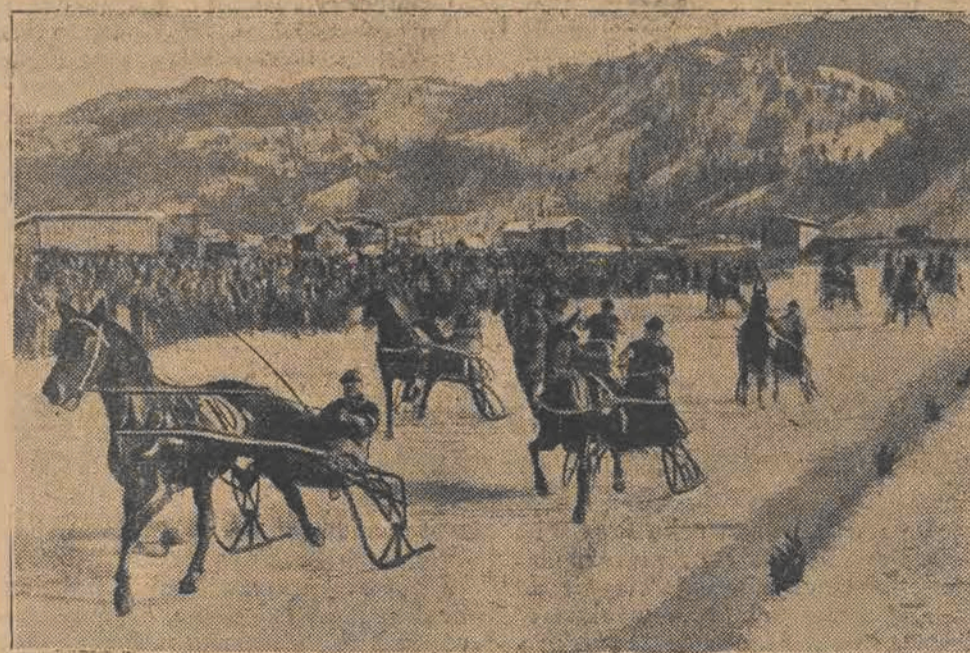
W bawarskich Alpach w miejscowości Partenkirchen, odbyły się oryginalne wyścigi sankowe. Na zdjęciu: moment końcowy emocjonujących zawodów.