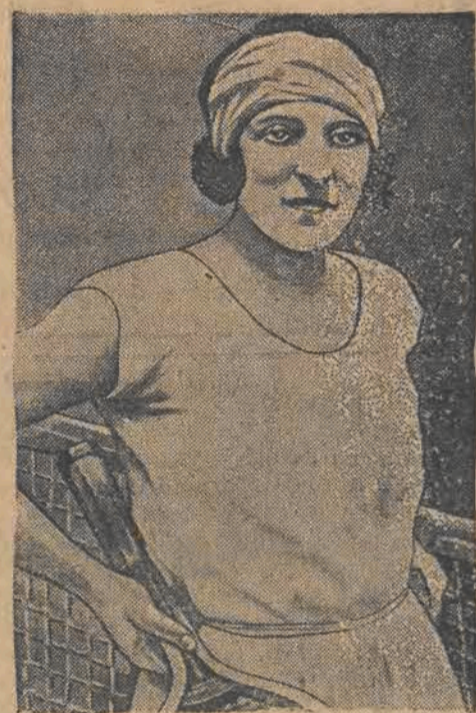
„Boska” Zuzanna Lenglen znikła nagle z domu swej przyjaciółki w Los Angeles, nie uprzedzając nikogo o miejscu swego pobytu. Amerykanie przypuszczają, że sławna tenisistka — albo popłynęła samobójstwo, albo zdobyła się na nowy trick reklamowy...