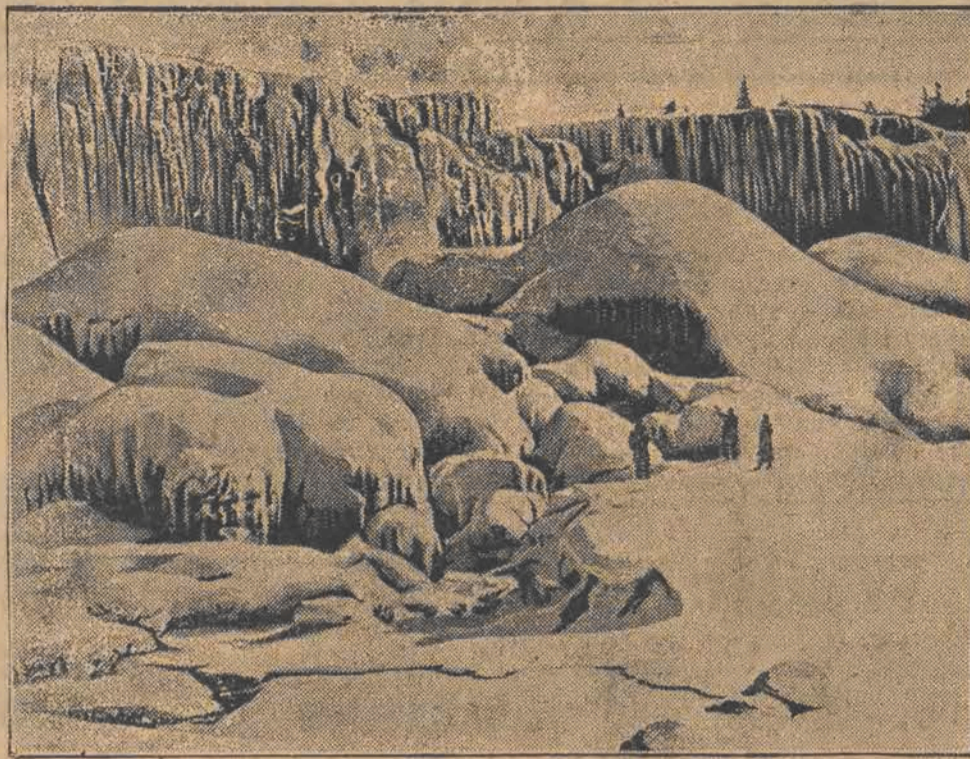
Wodospad Niagary zamarł, olbrzymie zwały wodne zamieniły się w potężne masy lodu. W tym stanie przedstawia wodospad przepiękny, fantast. widok.