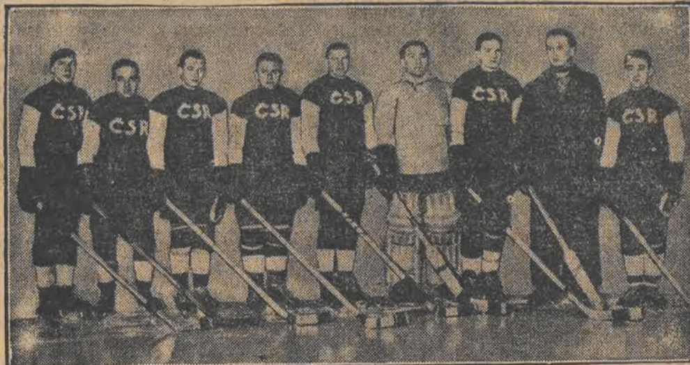
Drużyna czechosłowacka zdobyła mistrzostwo Europy w hockey'u na lodzie.