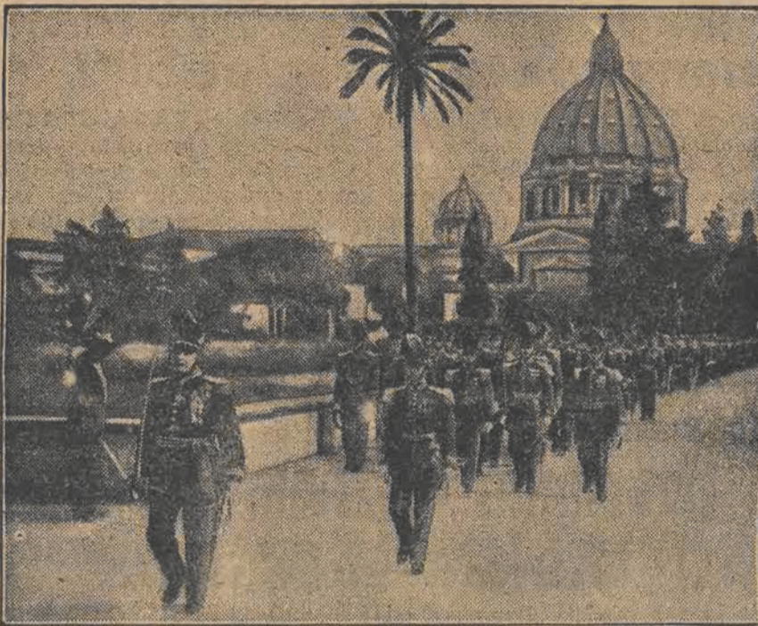
Historyczna gwardia papieska złożona z szwajcarów, awansuje teraz do znaczenia „rzeczywistego" wojska.