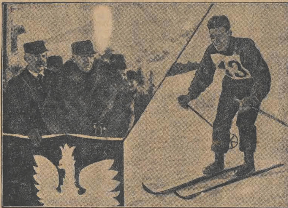
W biegu 18-kilometrowym zwyciężył Finlandczyk Saarinen w czasie 1:20:03. Z lewej strony — w futrze: pan Prezydent Mościcki, śledzący z zainteresowaniem ciekawie ze zawody.