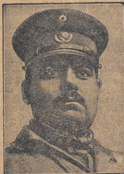
GENERAL ESCOBER dowódca rządowych wojsk meksykańskich — przeszedł na stronę rewolucji.

Przechodząc przez ulice rozejrzyj się uważnie unikaj niebezpieczeństwa i śmierci.