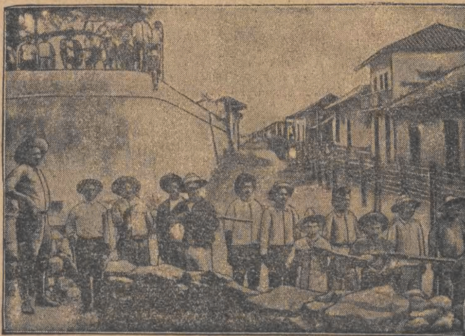
Rewolucjonści w walce na barykadach.