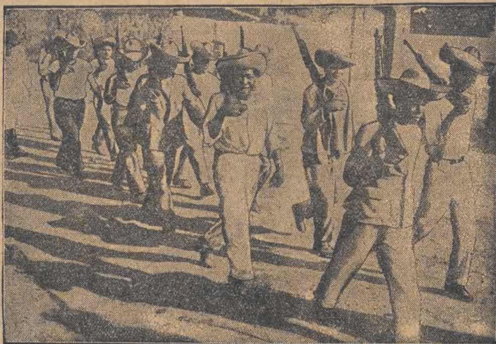
Powstańcy w marszu.