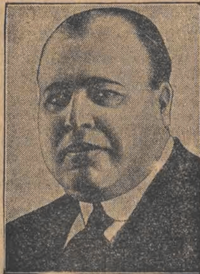
LUIS MORONES przywódca proletariatu meksykańskiego — zawzięty przeciwnik ruchu rewolucyjnego.

Anglik Gillis Grafström zdobył tytuł mistrza świata w jeździe figurowej