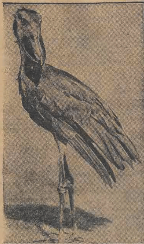
Ptaka Abu Markub z rodziny olbrzymich bocianów amerykańskich, jeden z najrzadziej spotykanych okazów ptaków, wielce trudny do schwytania z powodu plochliwości, został w tych dniach sprowadzony do Europy i umieszczony w znanym parku Hagenbecka pod Hamburgiem. Jest to jeden z bardzo nielicznych okazów w Europie.