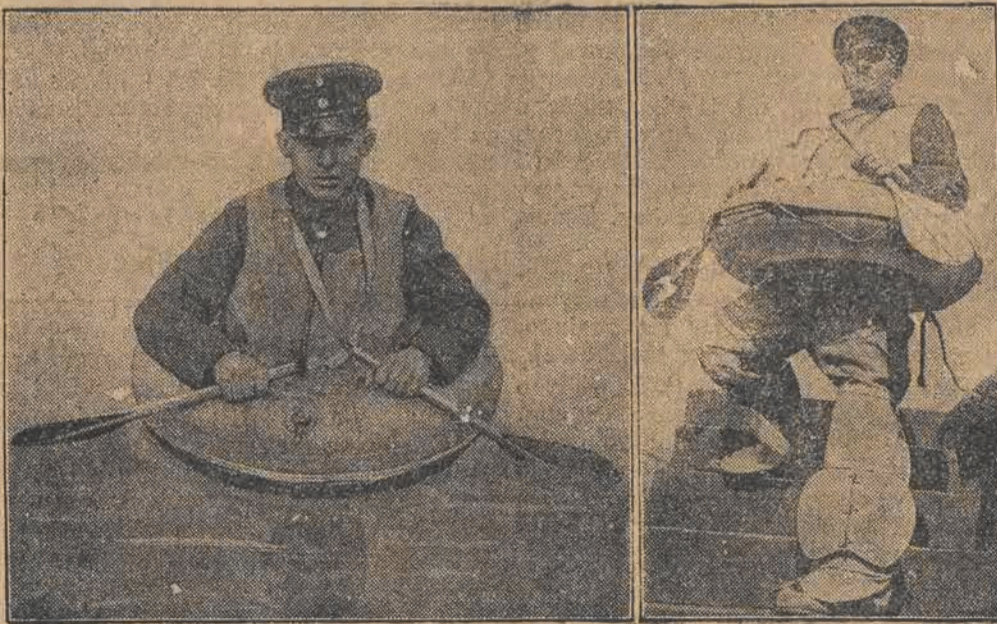
W dziedzinie ratownictwa tonących dokonano ostatnio nowego wynalazku. Jest nim gumowe ubranie, którego ścianki wypełnione są powietrzem. Na zdjęciu: nowy wynalazek oraz sposób jego zastosowania w wodzie.