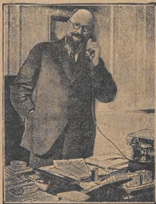
THORWALD STAUNING przywódca socjalistów w Danii, któremu niezawodnie — po rozwiązaniu obecnego gabinetu — powierzona zostanie misja utworzenia nowego rządu duńskiego.