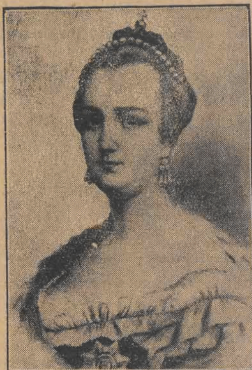
Dnia 2 maja upływa 200 lat od chwili urodzenia carycy Rosji, KATARZYNY WIELKIEJ. Jak wiadomo, była ona największą rozpustnicą swej epoki.