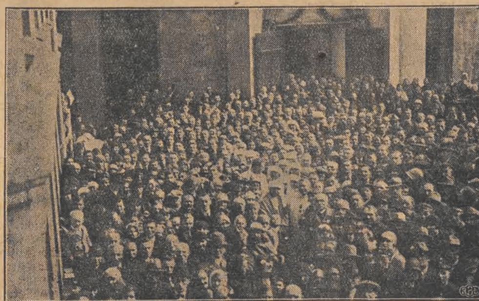
Arcybiskup Kowalski i duchowni marjawiccy przed kościołem marjawitów na ul. Franciszkańskiej 27.