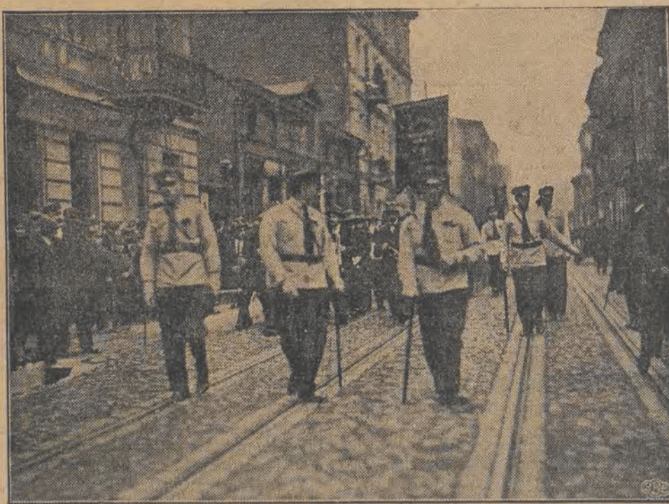
Milicja P. P. S. w niebieskich koszulach z czerwonymi krawatami.