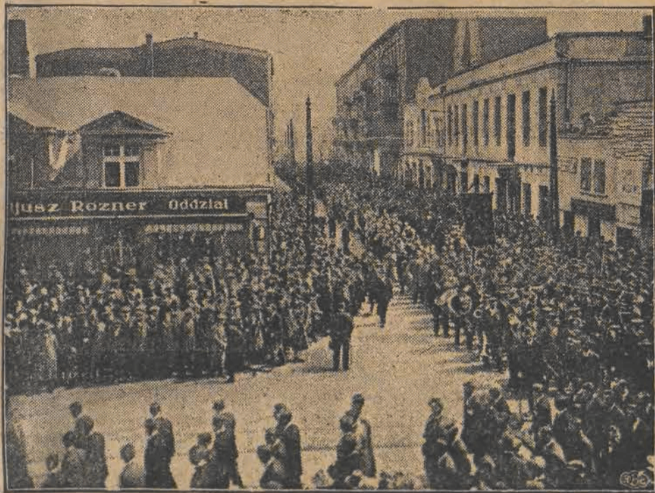
Fragment pochodu przy zbiegu ulic Piotrkowskiej i Główniej.