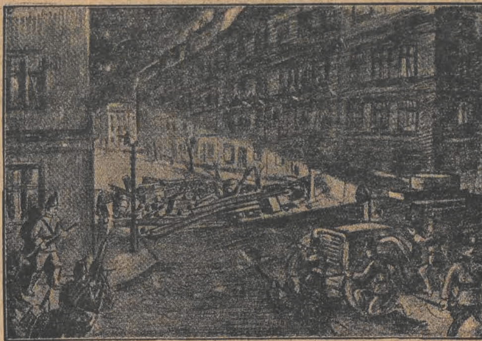
W BERLINIE — pod znakiem komunistycznej rewolty.