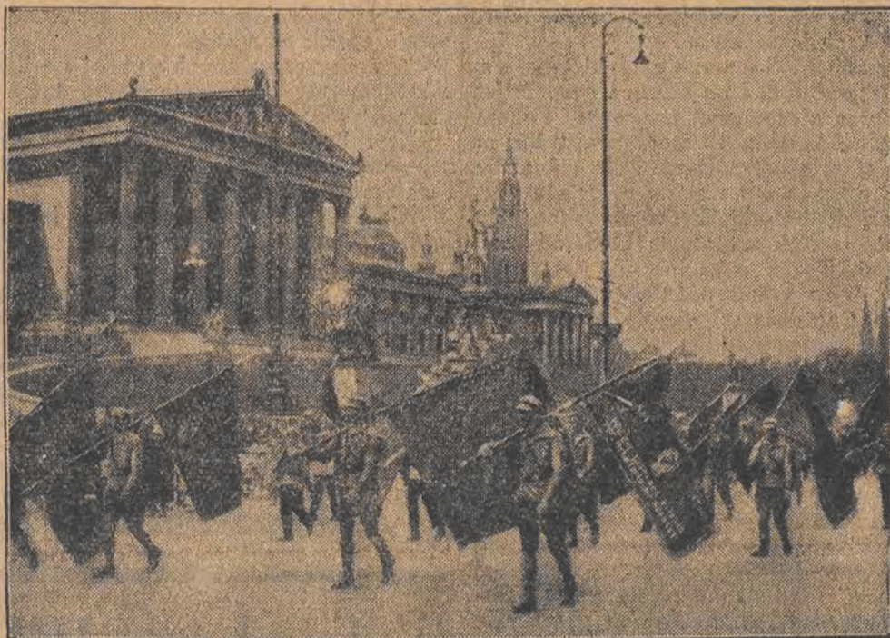
W WIEDNIU — pod znakiem spokojnych manifestacji młodzieży robotniczej i