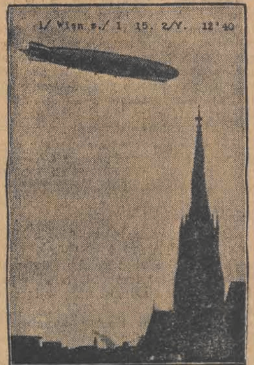
Zeppelin nad Wiedniem.