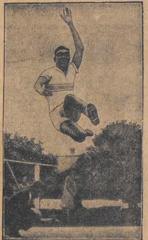
SYLVIO CATOR murzyn z wyspy Haiti, osiągnął rekord wszechświatowy skokiem na okrągłe 8 metrów w dal.