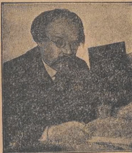
PIATAKOW, nowy prezydent sowieckiego banku państwowego.

Ryga, 7 maja. Wskutek wielkich opadów deszczów Dźwina wezbrała tak gwałtownie, że poziom wody osiągnął 8 m. ponad normalny stan. Przedmieście Dynaburga, Warszawka, zupełnie jest odcięte od miasta. Komunikacja musi być podtrzymywana przy pomocy łodzi. Linja kolejowa Dynaburg — Indra na przetrzeźni 3 km. jest zalana wodami. Podobnie pod Rygą znowu zaczynają wzbierać wody. Wczoraj poziom wynosił 4 m. ponad stan normalny.