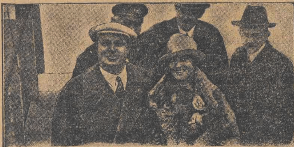
Emil Jannings opuszcza Hollywood i po wraca do Europy, zdobywszy sobie w Ameryce tytuł największego charakterystycznego aktora ekranu. Na zdjęciu: Jannings z towarzyszącą mu wszędzie małżonką.