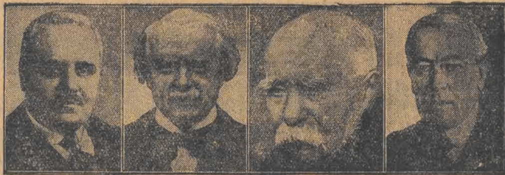
NITTI (Włochy), LLOYD GEORGE (Anglia), CLEMENCEAU (Francja), WILSON (St. Zjedn.)