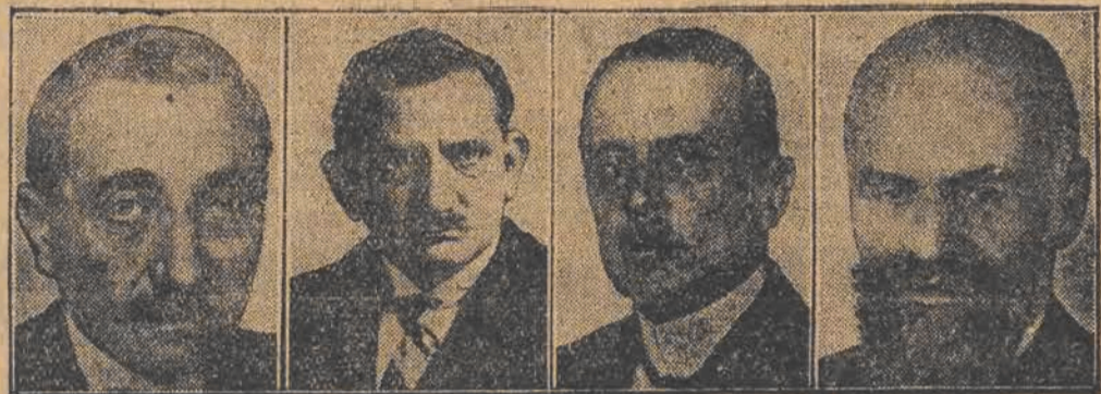
MELCHIOR, SCHUECKIG, BROCKDORFF-RANTZAU, LANDSBERG

Dnia 7-go maja r. b. upływa 10 lat od chwili rozpoczęcia układów o traktat pokojowy po wielkiej wojnie, zawarty w Wersalu pod Paryżem. Powyżej podajemy wizerunki głównych osób, które działały przy zawarciu tego historycznego aktu.