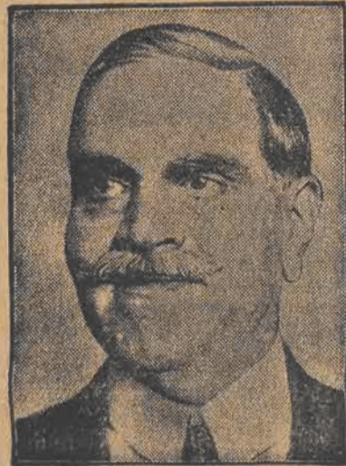
KSIAŻE KAPURTHALA, jeden z największych indyjskich maharadzów, przybył do Europy i odwiedza stolice europejskie.