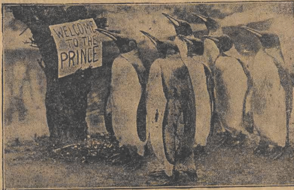
Książę Walji zwiedził ogród zoologiczny w Londynie. Na zdjęciu widzimy stado pingwinów manifestujących na cześć księcia.