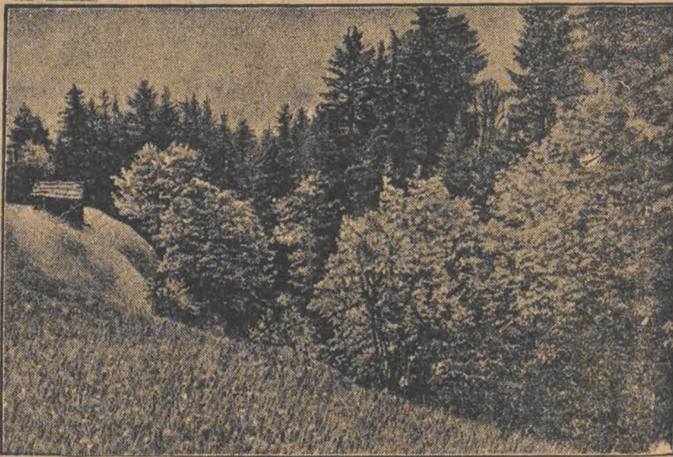
Wiosna w górach w całej pełni. Natura cała zbudziła się z zimowego snu do życia, rozciągając swój urok dokoła.