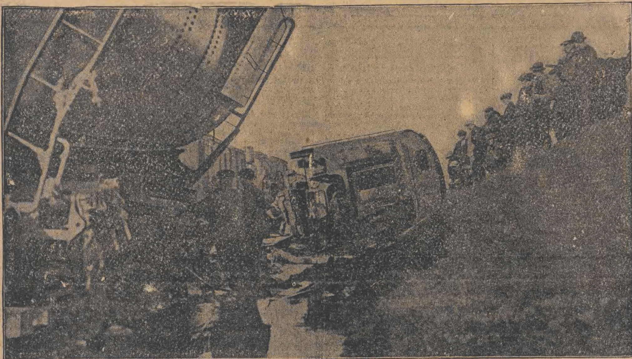
Widok strasznej katastrofy kolejowej, która zdarzyła się w Kanadzie, koło miasta Toronto. Uprzątnięciem gruzów zajęła się cała eskadra robotnicza.