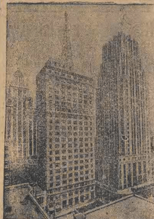
Nawet niewielkie miasta, w Ameryce posiadające nie więcej, niż 80.000-100.000 mieszkańców, mają swoje drapacze chmur. Zdjęcie nasze przedstawia śródmieście niewielkiego stosunkowo miasta Houston (w st. Teksas). Wygląda ono wcale po wielkomiejsku...

Prenumerata. W Łodzi 4.00 miesięcznie. — Zamiejscowe 5 zł. miesięcznie. — Zagranicą 7 złotych miesięcznie.