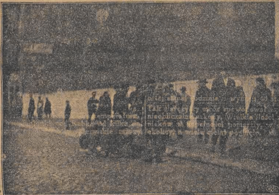
Opatrywanie rannego na ulicy Rzgowskiej.