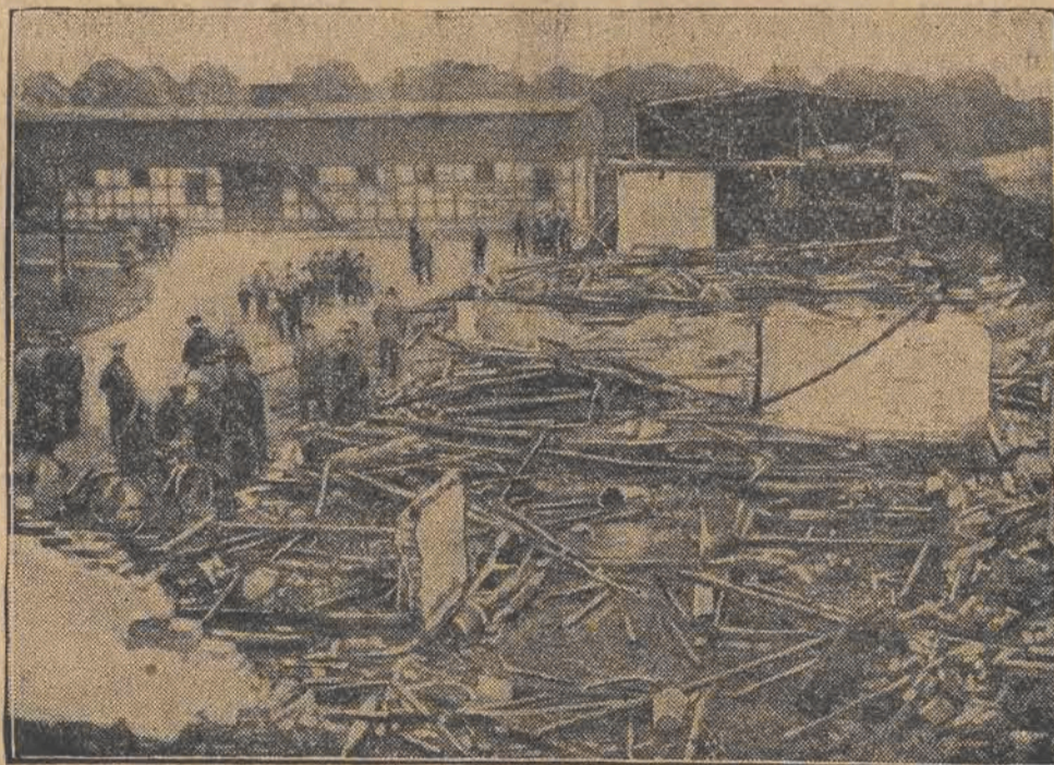
Pod Hamburgiem, w stajniach koni wyścigowych, wybuchł pożar, którego ofiarą padło 15 wartościowych koni. Na zdjęciu gruzy, które pozostały po wartościowych stajniach.