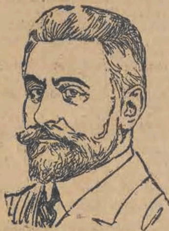
Jak już donosiliśmy, wykryto w Bukareszcie spisek przeciwko obecnemu premierowi Maniu. Ogólnie panuje mniemanie, że przywódcą spiskowców jest były premier rumuński Bratianu. Na zdjęciu: premier Maniu (u góry) oraz Bratianu (u dołu).