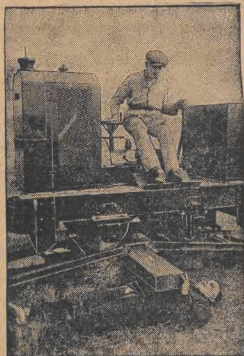
Czytelnicy pamiętają fenomenalnego siłacza Zygmunta Breitbarda, który potrafił dźwigać na sobie ciężary, przekraczające wytrzymałość klatki piersiowej normalnego człowieka. Obecnie w Anglii pojawił się nowy fenomenalny siłacz Lichterfeld, który wytrzymał na swej klatce piersiowej ciężar lokomotywy elektrycznej.