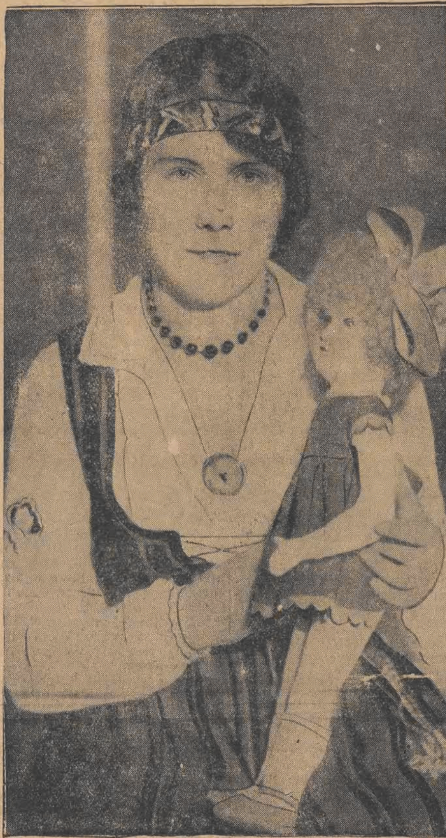
W ubiegłym tygodniu zakończyły się w Budapeszcie obrady międzynarodowego zjazdu esperantystów. Ostatniego dnia wybrano najplekniejszą uczestniczkę zjazdu, jako „Miss Esperanto“.