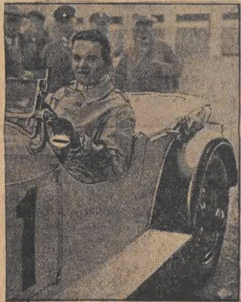
W Belfast, w Irlandji odbył się w tych dniach międzynarodowy wyścig samochodów. Zwyciężył Włoch Rudolf Caracciola, na wozie wyścigowym Mercedes-Benz.