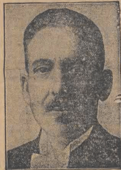
SIR ABDUL MUHSIN

premier rządu w Iraku, popełnił samobójstwo przy pomocy rewolweru. W pozostawionym liście do syna podał on jako przyczynę tragicznego czynu — zniechęcenie do życia, spowodowane trudnościami w dążeniu do celów politycznych.