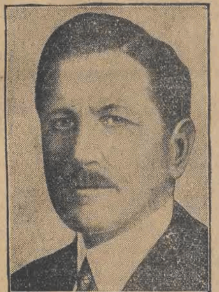
HURLEY nowomianowany amerykański sekretarz stanu dla spraw wojskowych.

Prenumerata W Łodzi 2,90 miesięcznie.—Zamiejscowe 3,50 zł. miesięcznie.—Zagranicą 5,60 zł. miesięcznie. Odnoszenie do domów 40 groszy.