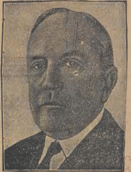
ROLAND BOYDEN, nowomianowany amerykański rzeczoznawca w sprawach odszkodowań wojennych Niemiec na rzecz St. Zjednoczonych.