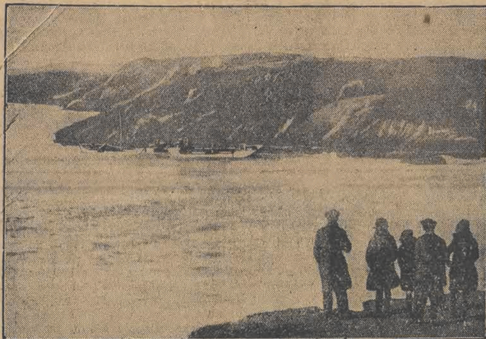
Na wybrzeżu Południowej Walii angielski statek „Moles” natknął się na skałę podwodną i osiadł na dnie. Katastrofa wydarzyła się w czasie nocy, pochłaniając 8 ofiar ludzkich. Na zdjęciu: szczątki zatopionego statku.