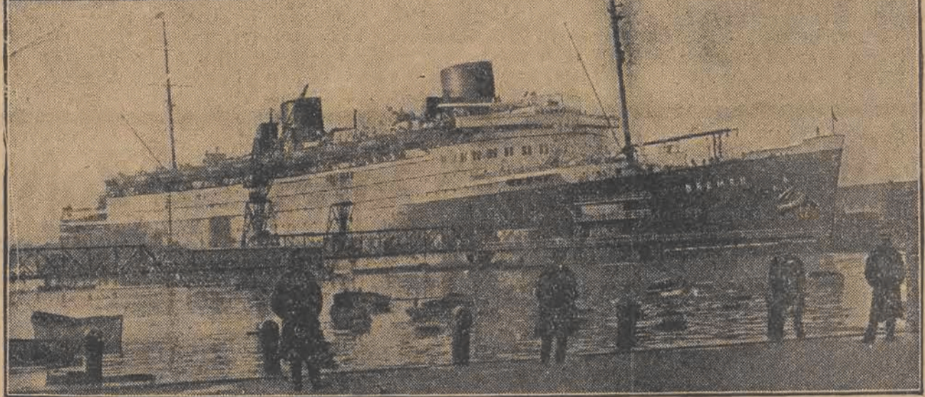
Ołbrzymi niemiecki okręt transatlantyczny „Bremen”, który niedawno zdobył rekord szybkości w przepłynięciu oceanu z Europy do Ameryki, zaczyna już się psuć... Doznał on pewnych uszkodzeń w śrubach okrętowych i będzie reperowany w porcie angielskim Southamton. U góry: uszkodzone śruby tego ołbrzyma.