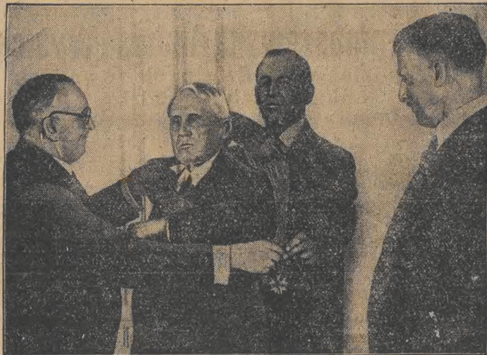
B. amerykański sekretarz stanu Kellogg, twórca znanego paktu, został udekorowany przez rząd francuski wielkim krzyżem legii honorowej. Na zdjęciu: ambasador francuski w Waszyngtonie, Claudel (z lewa) zawieszka Kellogowi honorową odznakę.