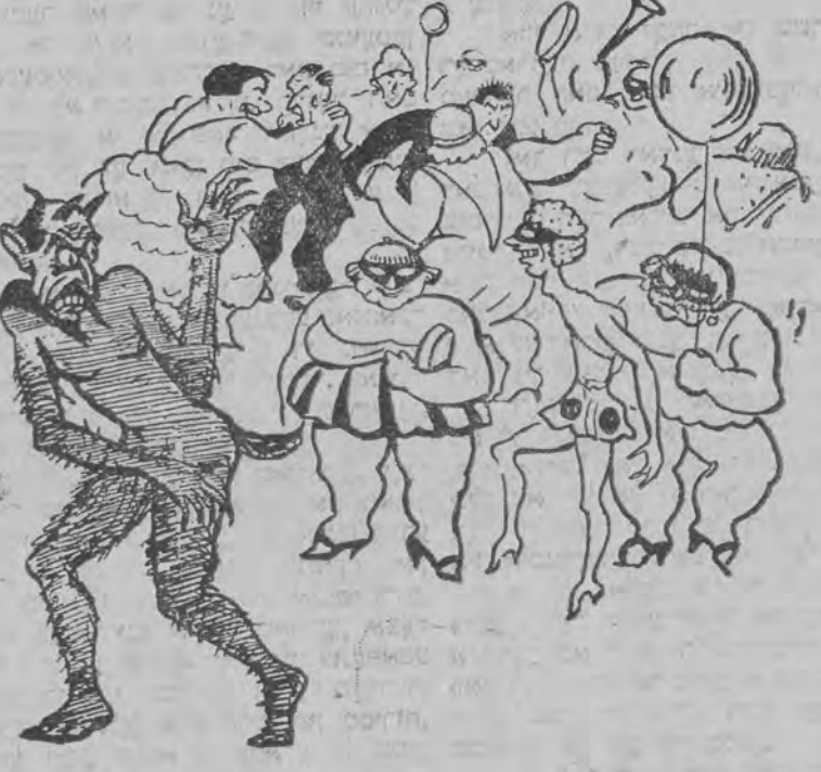
קריזיס: אויך דא ביי אידן! איך פערטרעט די מענער, וועלכע האבען זיך גוט צו קאפן, ווי אזוי זיך ארויסצוקאפען פון קריזיס.