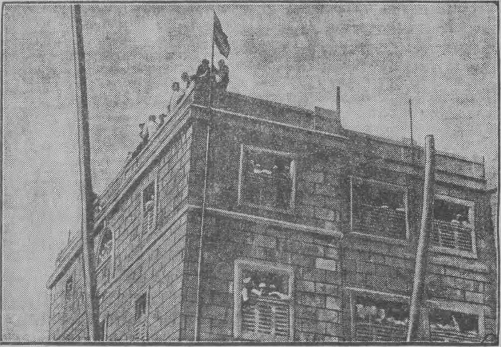
ארעסטירטע הינדוסן האט מען צוליב סאנגעל אין בסיסות פריינדקעס אין 8 הויזבוים האבען זיי אויפן הויז צווייטגעגאנגען זייערע נאציאנאלע פאזן

מארשא 3 (סעלעפאניש) פון איבער קא-רעפארענעס. הן מען דערוואקס נון האט דער קרא-קאווער וואיעוואדען פולקאוועס קראשניעווסקי וועל-בער און נעכטען ערום אפגעפארענע פון היינטיג קיין קראקא איבערגעגעבען דער דארטנער געריכטס-מאג אירע מאטעריאלען וועגען דעם קראקאווער סאב-רעס.