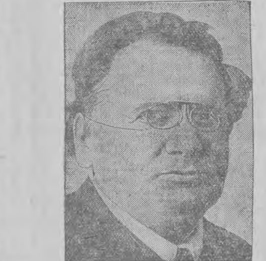
דער נייער קאמיסאר ליטווינאוו