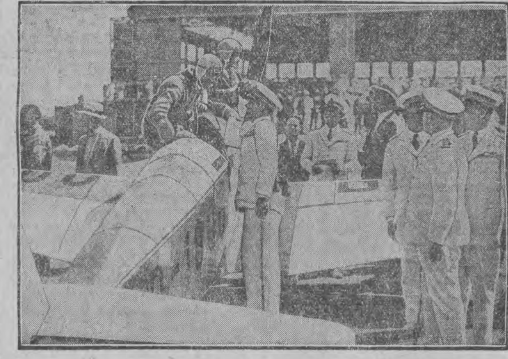
איטאליענישער מינישטער באזעץ בעגרסט דעם זינער פון פליה לוטער