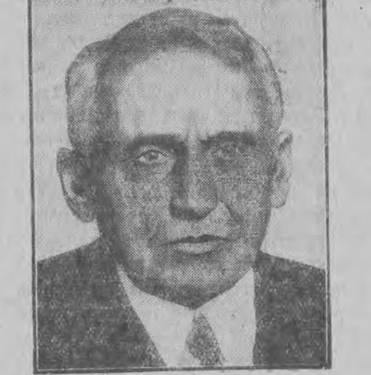
געווי אַמערקאַנער אויסערן-מיניסטער קעלאַג און די סופרין אויפ'ן סאָציאַלען נעביט דושין אַראַמט