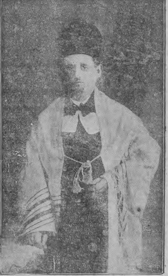
אבעראקאנטאר פארראבינעק דאווענט אין פילהארמאניע

מעלדונגען אָרש. געזאנג פראיין ביי „פועלי אגודת ישראל“ לודז, ווסקאניא 66. דערמיט מעלדען מיר אלע אונזערע פערטליכע בענע מיטגלידער, און מאַרען שבת דעם 20-טען סעפטעמבער ד. י. פונקטליך 2 נאכמיטאג קומט פאר אין אייגענעם לאקאל ווסקאניא 66 די ערשטע לעקציע צו וועלכע אלע מיטגלידער מוזען אונבע- דינגט קומען פונקטליך. איינשרייבונגען קומען נאך פאר. גלייכצייטיג מעלדען מיר, דאס די לעקציעס פאר.