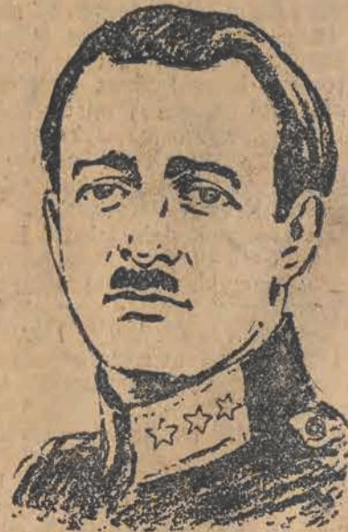
król Albanji, jest już od dłuższego czasu bardzo poważnie chory. Obecnie donoszą, że stan jego pogorszył się znacznie. Choruje on na suchoty, lekarze nie roją żadnych nadziei na wyzdrowienie.

Prenumerata W Łodzi 2.90 miesięcznie.—Zamiejscowe 3.50 zł. miesięcznie.—Zagranicą 5.60 zł. miesięcznie. Odnoszenie do domów 40 groszy.