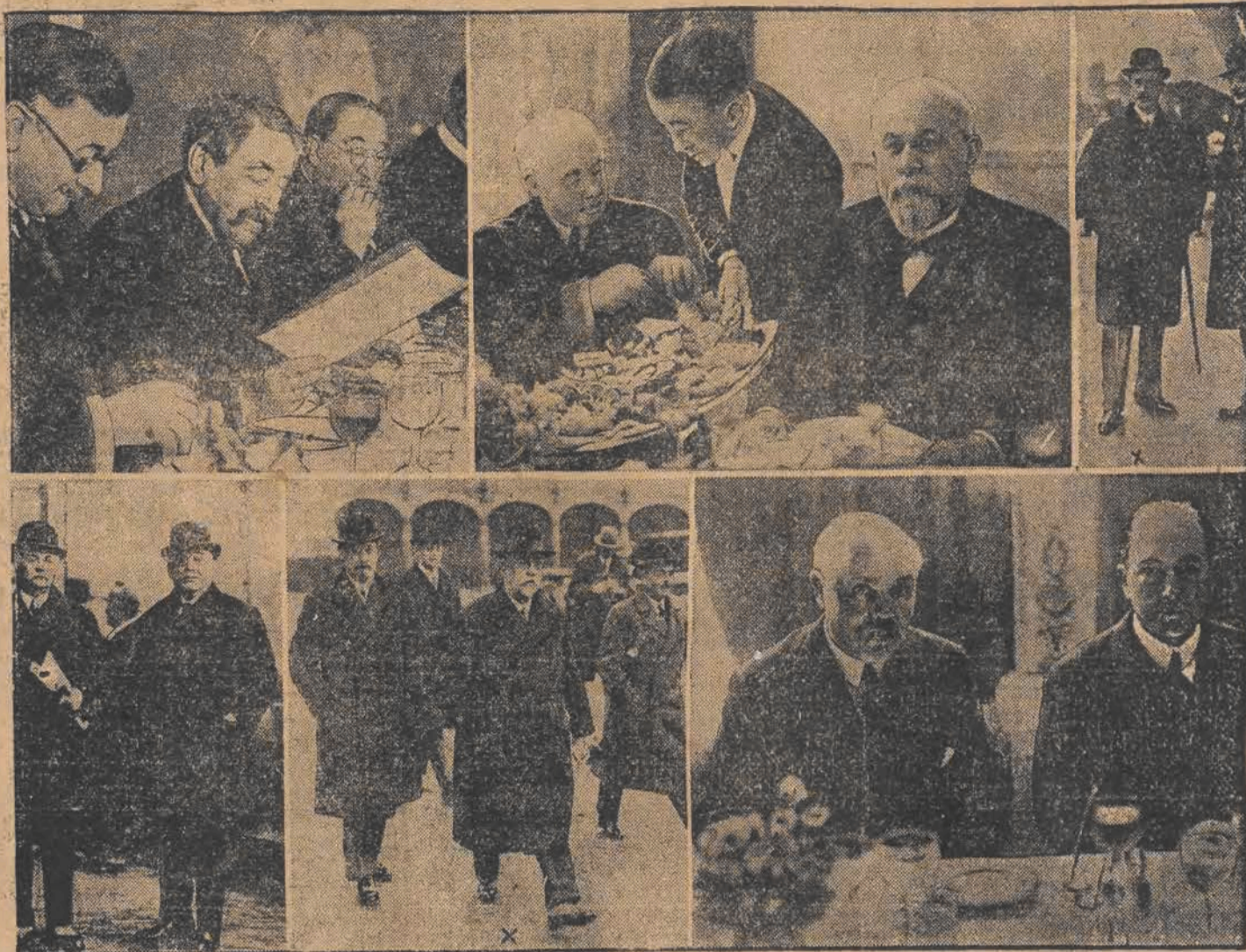
U góry z lewa: WIRTH, BRIAND, ROBERT SCHMIDT — podczas wspólnego śniadania. Pośrodku u góry: MOLDENHAUER i CHERON. U góry z prawa: BETHLEN (x) premier gabinetu węgierskiego oraz BLOCKLAND, holenderski minister spraw zewnętrznych. U dołu z lewa: JASPAR, premier gabinetu belgijskiego oraz FRANQUI. Pośrodku SCHÖBER na czele austriackiej delegacji. U dołu z prawa LOUCHEUR i CURTIUS przy śniadaniu.