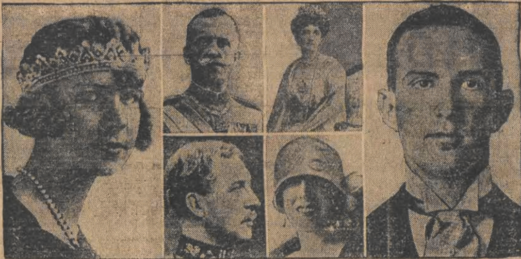
Dziś, 8-go b. m., odbędą się w Rzymie zaślubiny belgijskiej księżniczki z włoskim następcą tronu. — Z lewa: Narzeczona, księżniczka Marja Józefina; pośrodku u góry: król włoski oraz królowa, rodzice narzeczonego; pośrodku u dołu: król belgijski oraz królowa, rodzice narzeczony; z prawa narzeczonego, książę Humbert.