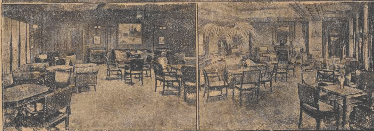
U góry: widok ogromnego parowca transatlantyckiego „Muenchen“, który w tych dniach spłonął doszczętnie w porcie nowojorskim. U dołu — z lewa: palarnia, z prawa — salon. „Muenchen“ należał do najpiękniejszych, luksusowych parowców transatlantyckich.