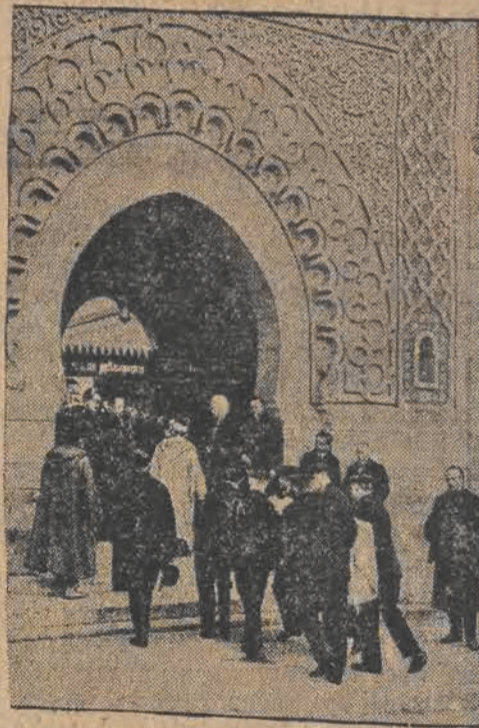
Wnieśenie trumny ze zwłokami do meczetu mahometańskiego w Paryżu.