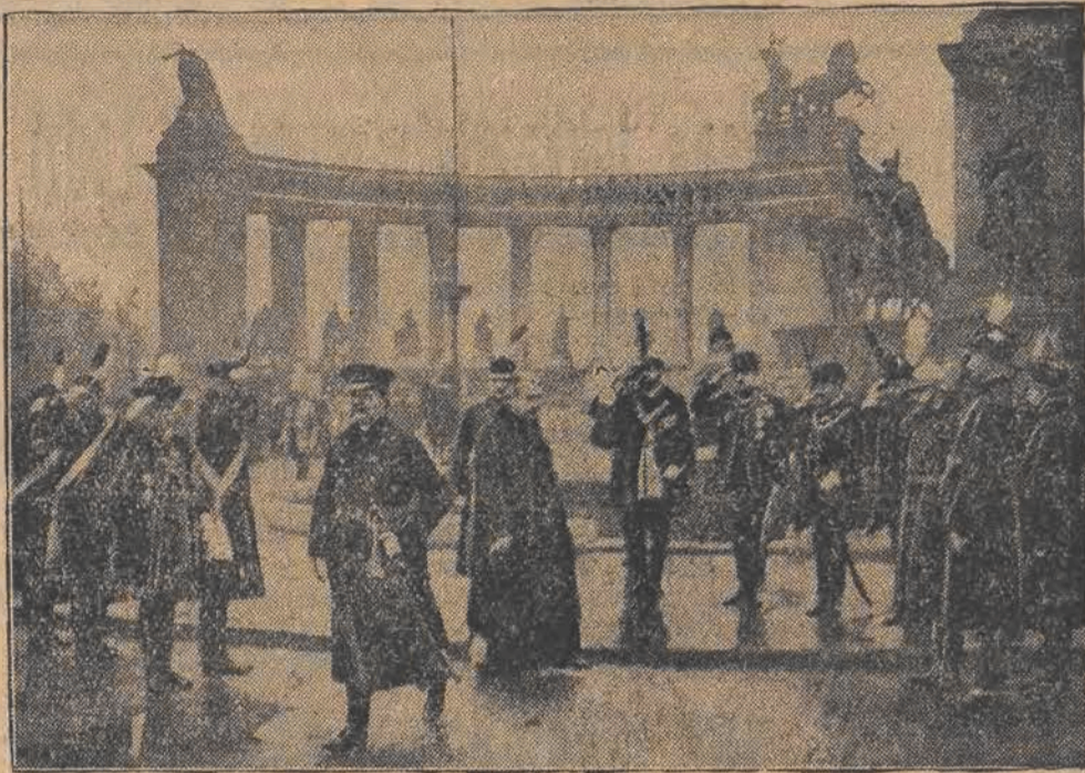
Admirał HORTHY (na przedzie) przed pomnikiem niepodległości Węgier.