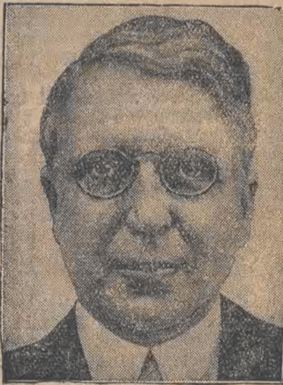
JOHN WILLYS, nowy ambasador Stanów Zjednoczonych w Warszawie.

Od roku 1919 do 1929 liczba chorych na tyfus plamisty wynosiła około 30 milionów, z czego 2 i pół miliona zmarło. Do szerzenia tyfusu przyczyniają się anty-sanitarne stosunki w miastach sowieckich.