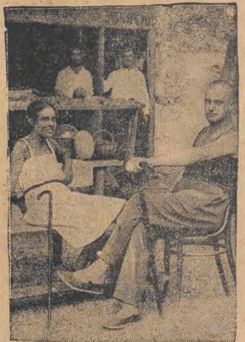
WŁODZIMIERZ MAJAKOWSKI, słynny piewca komunistycznej Rosji, popełnił samobójstwo. Na zdjęciu: poeta oraz jego małżonka.