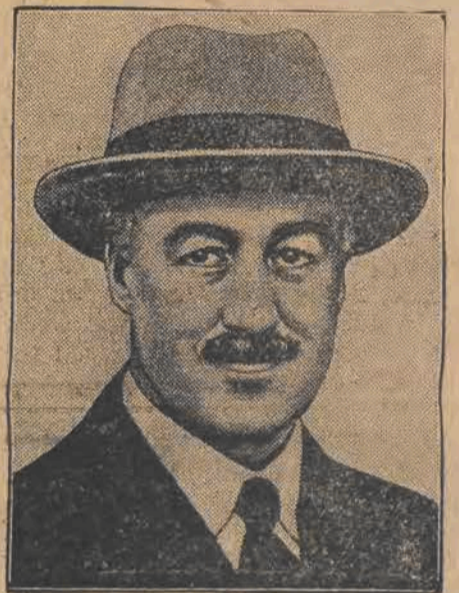
SIR CHANCELLOR, angielski Wysoki Komisarz w Palestynie podał się do dymisji.