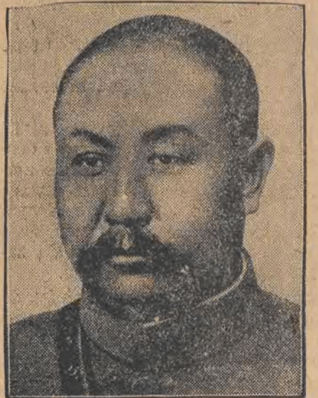
GENERAL YEN SI SHAN, przywódca północnej armii chińskiej, okazał się niezwykłym wrogiem Niemiec. Wydał on rozkaz rozstrzelania natychmiastowego wszystkich niemieckich oficerów, będących w obecnej chińskiej wojnie domowej na służbie w armii południowej a wziętych przez północną armię do niewoli.

Prenumerata. W Łodzi 2,90 miesięcznie. — Zamiejscowe 3,50 zł. miesięcznie. — Zagranica 5,60 zł. miesięcznie. — Odnoszenie do domów 40 groszy.