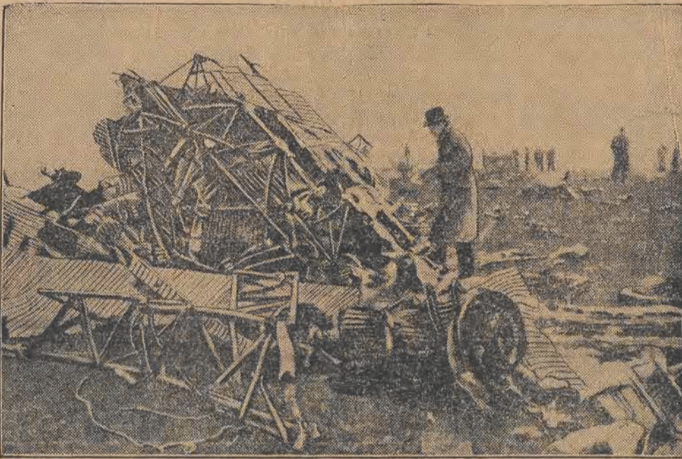
Samolot pocztowy, kursujący pomiędzy Londynem a Berlinem, runął podczas przelotu nad hrabstwem Surrey i spłonął w przeciągu krótkiego czasu. W płomieniach zginęli pilot oraz mechanik. — Na zdjęciu: szczątki samolotu.