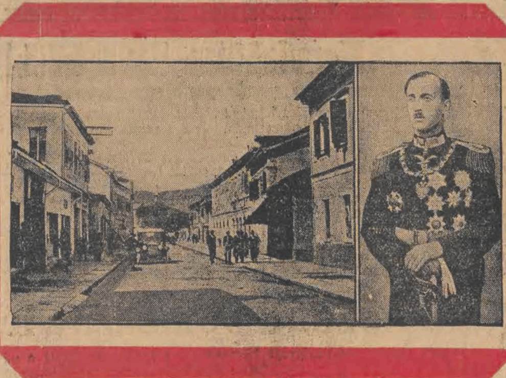
Rząd włoski wysłał znaczne oddziały wojsk przez Skutari, stolicę Albanii, na granicę albańsko-jugosłowiańską. Napotkało to początkowo na sprzeciw ze strony władz portowych w Skutari, okazało się jednak, że dzieje się to na mocy cichego porozumienia pomiędzy rządem włoskim a władcą Albanii królem Zogu. Na zdjęciu: z lewa — główna ulica miasta Skutari; z prawa — król Achmed Zogu