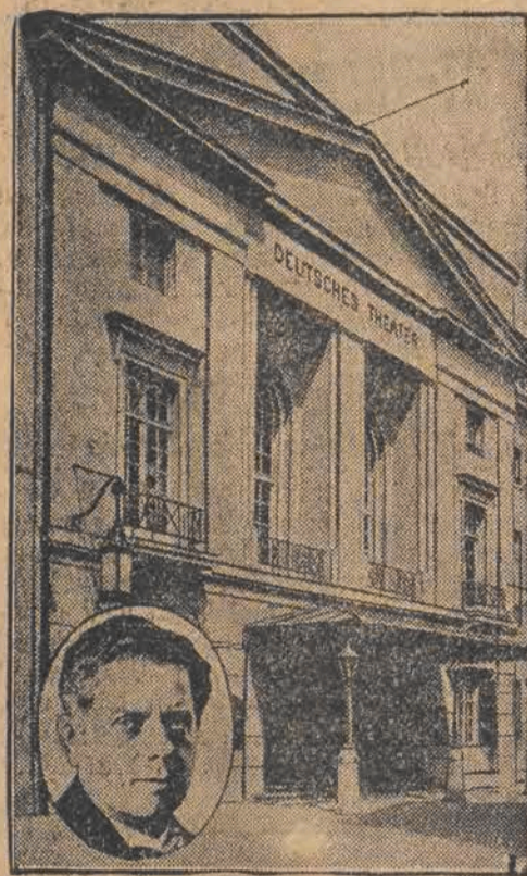
Słynny reżyser niemiecki MAKS REINHARDT (u dołu, w owalu), jedna z największych znakomitości w dziedzinie teatru europejskiego, obchodzi — jak już donosiliśmy — 30-go br. 25-letni jubileusz swej działalności. Na zdjęciu: główny teatr Reinhardta „Deutsches Theater“ w Berlinie.

Na zdjęciu: charakterystyczny widok Gdańska.