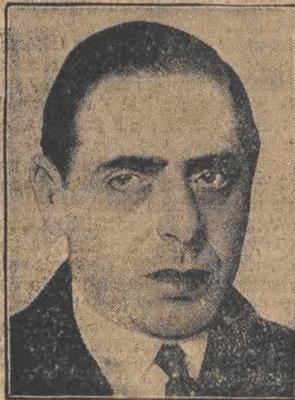
Znany telepata i jasnowidz ERYK JAN HANUSSEN, który odpowiada obecnie przed sądem w Leitmeritz (Czechosłowacja) jako oskarżony o oszustwo na tle jasnowidztwa. Proces ten wzbudził olbrzymie zainteresowanie, bowiem oskarżony o oszustwo jasnowidz jest w tej dziedzinie sławą wszechświatową i został niejednokrotnie uznany przez znanych przedstawicieli wiedzy i nauki europejskiej jako cudowne medium.

Prenumerata: W Łodzi 2,90 miesięcznie. — Zamiejscowe 3,50 zł. miesięcznie. — Zagranicą 5,60 zł. miesięcznie. Odnoszenie do domów 40 groszy.