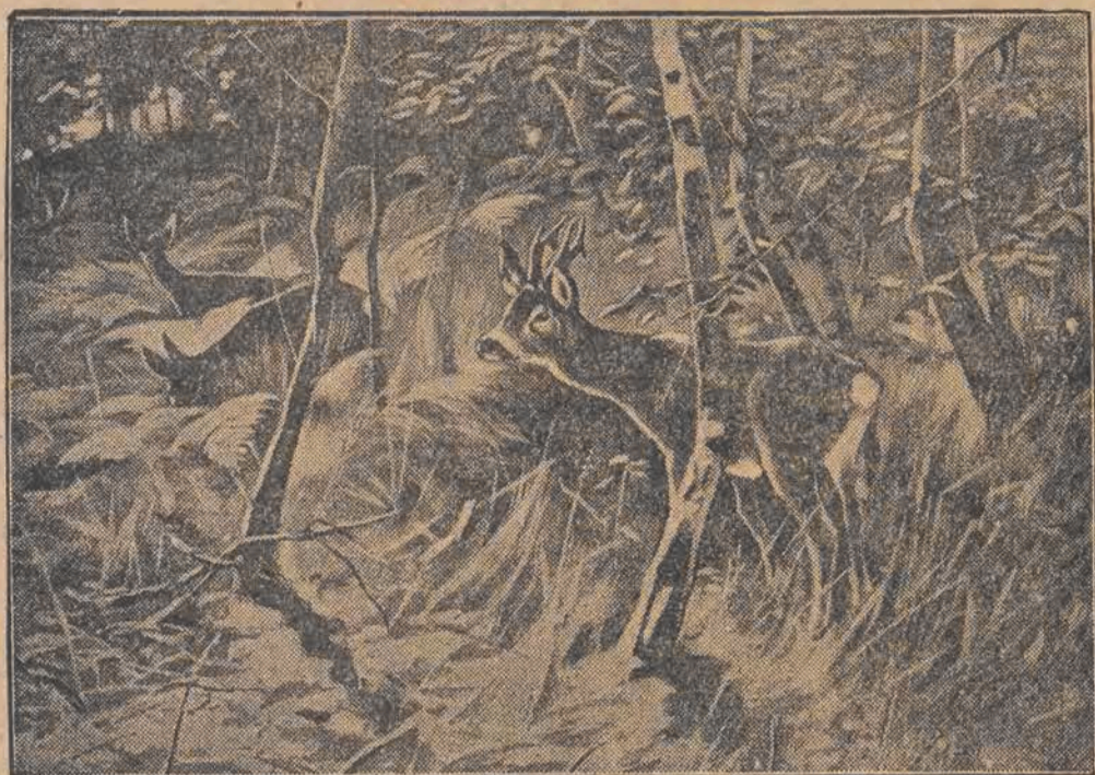
Sarenki w gęstwinie leśnej.