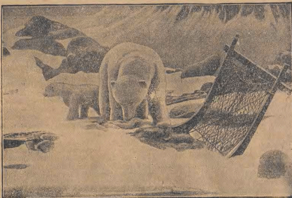
Biała niedźwiedzica oraz jej małe dziecko przeszukują pozostawione w śniegu sanie eskimoskie. — Jest to ciekawa plastyczna grupa, wystawiona w duńskim pawilonie na międzynarodowej wystawie futer, otwartej obecnie w Lipsku