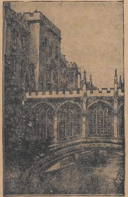
Piękny most, przylegający do gmachu uniwersyteckiego, w Cambridge (Anglja)