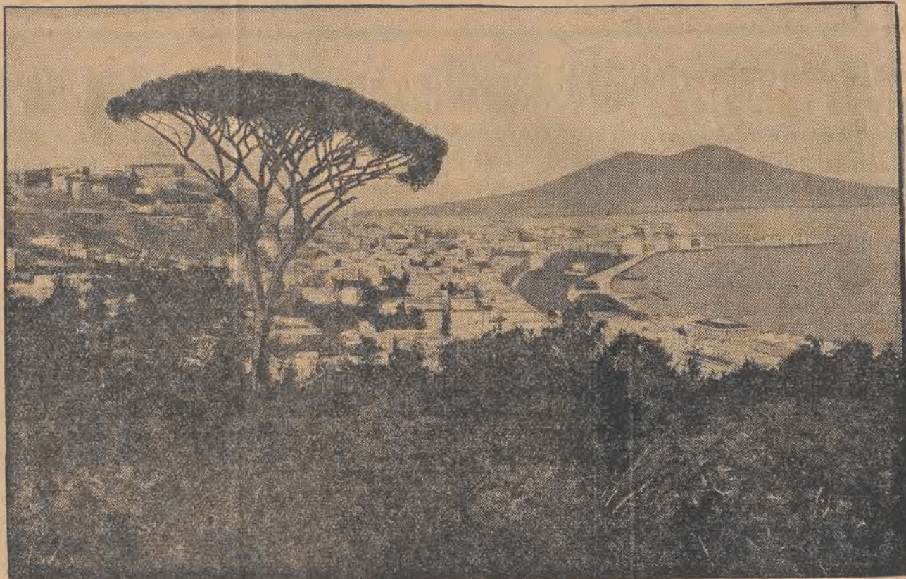
Ogólny widok Neapolu, tego bodaj najpiękniejszego zakątka kuli ziemskiej — zniszczonego częściowo obecnie przez olbrzymie trzęsienie ziemi.