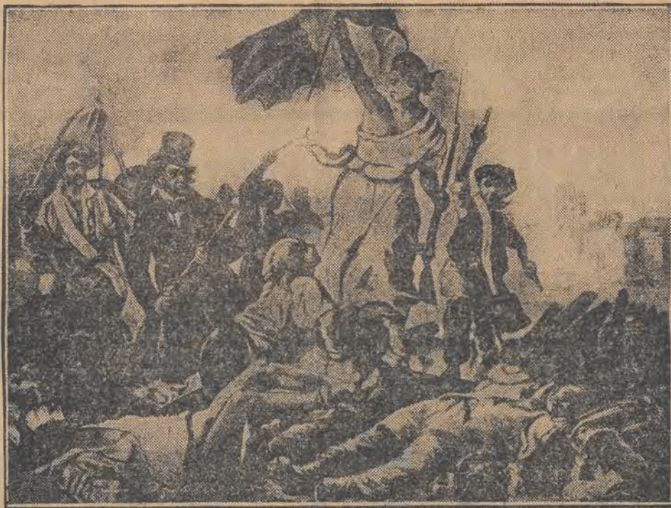
W dniu 27-ym b. m. upływa 100 lat od chwili wybuchu w Paryżu rewolucji lipcowej. Powyżej słynny obraz francuskiego batalisty Delacroix, przedstawiający fragment z ówczesnych walk na barykadach.