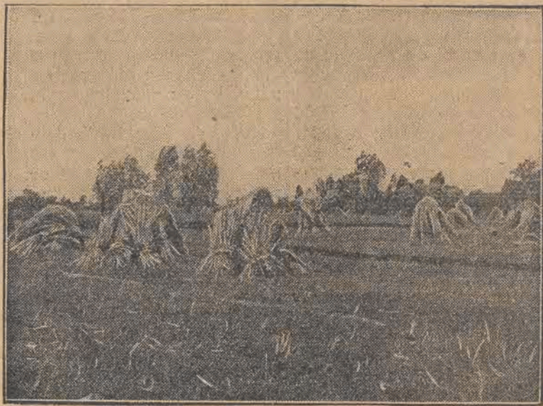
Mimo zmiennej pogody tegoroczne zniwa są już na ukończeniu. Urodzaje wypadły niezłe, maki zagranicznej sprowadzać nie będziemy.