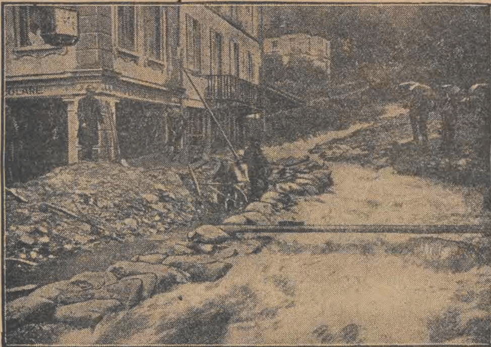
W Kantonie Tessin (Szwajcaria) szalała w tych dniach niebywała burza. Zwłaszcza ucierpiało miasto Locarno, którego strome uliczki zamieniły się — jak widzimy na powyższym zdjęciu w rwące potoki.