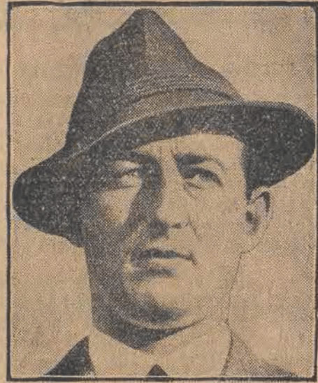
W nowym rządzie austriackim wicekanclerza Vaugoina teke ministra spraw wewnętrznych objął przywódca „Heimwehry”, książę Starhemberg.