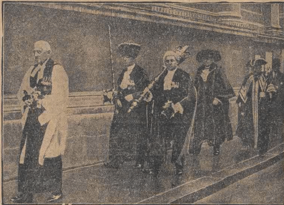
Nowy nadburmistrz Londynu Sir Phene Real (na przodzie) obejmuje uroczyscie władzę po swym poprzedniku Williamie Waterlowie.