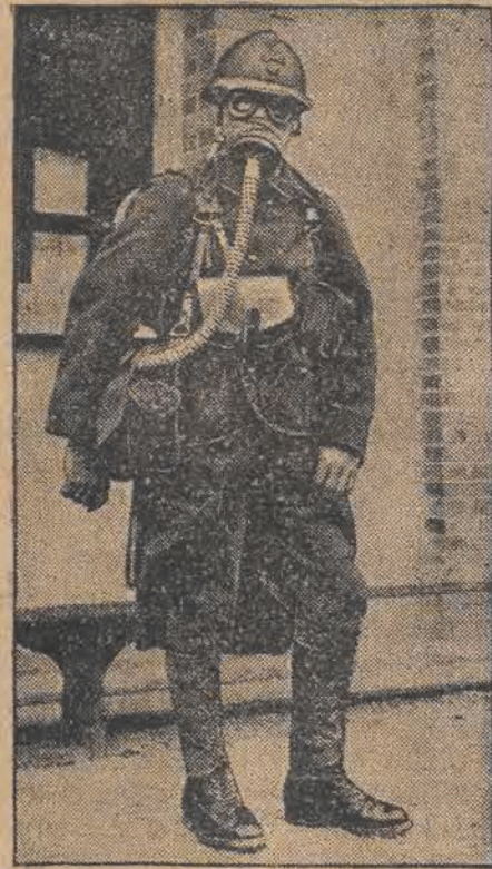
W czasie ostatnich manewrów francuskich i niemieckich wypróbowano nowe uzbrojenia dla żołnierzy, składające się przede wszystkim z nowego typu maski gazowej, mającej połączenie ze zbiornikiem powietrza w tornistrze.

Redakcja i Administracja Łódź, Piotrkowska 49. Telefon Administracji 1.22-14. Tel. Redakcji: 1.27-24, 1.36-43, 1.36-44, 1.89-00, 1.80-80.