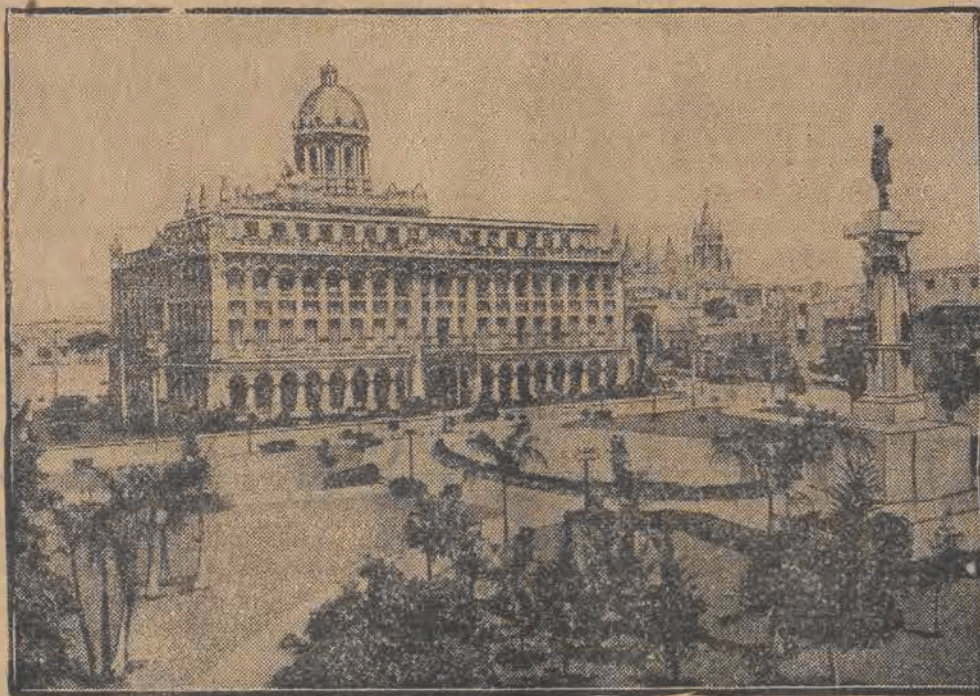
Pałac prezydenta w Habana na Kubie, przed którym zbrali się demonstranci w liczbie kilku tysięcy osób. Policja podczas rozpraszania demonstrantów użyła broni palnej. Wzajemna wymiana strzałów pociągnęła za sobą kilkanaście ofiar.