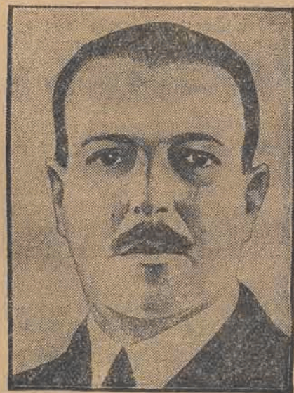
Nowoobрани prezydent republiki brazylijskiej dr. Luiz Prestes, który objął swój wysoki urząd państwowy w dniu 16 listopada.