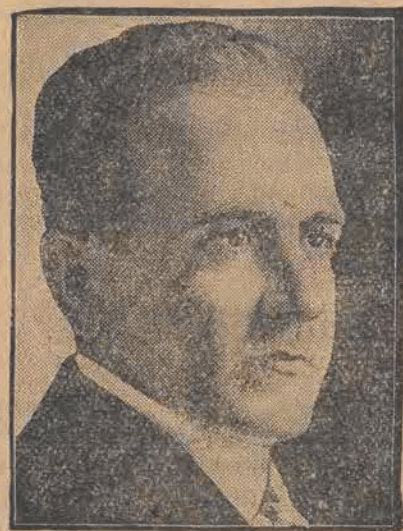
Przywódca ruchu rewolucyjnego w Brazylii, b. minister finansów dr. Getulio Vargas, którego kandydatura przepadła przy ostatnich wyborach na prezydenta państwa.