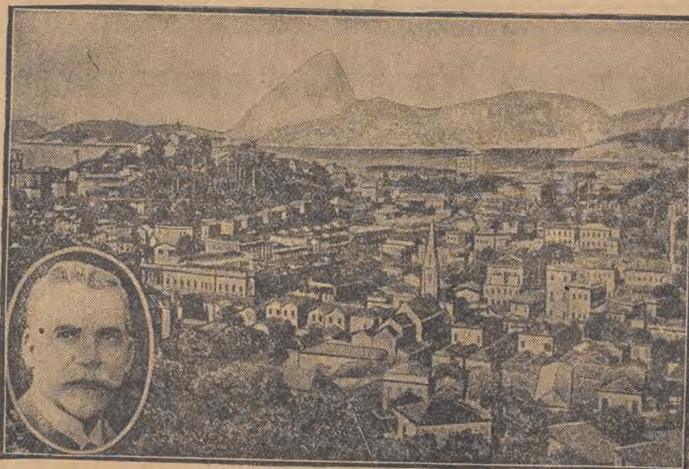
Rio de Janeiro, stolica Brazylii, jest obecnie celem ofensywy brazylijskich wojsk powstańczych, które za wszelką cenę nie chcą dopuścić do objęcia władzy przez nowo wybranego prezydenta państwa dr. Luiz Prestesa.