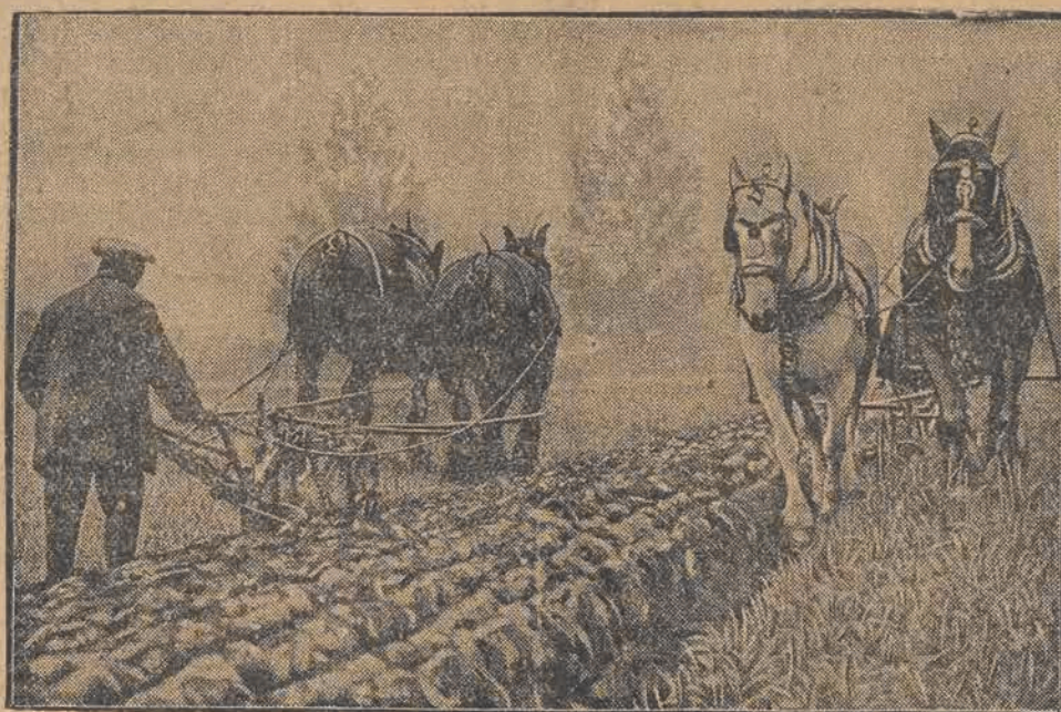
Na pola znów wyszedł rolnik z plugiem, przeorać niwę na oziminy.