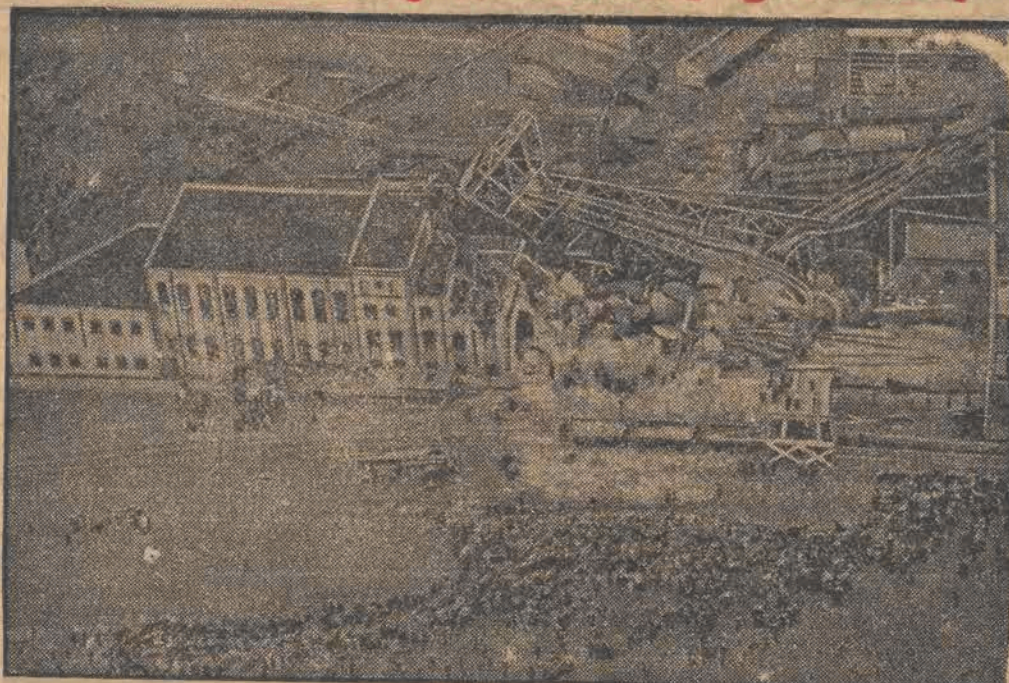
Z Alsdorfu, miejsca strasznej katastrofy górniczej, dochodzą dalsze wstrząsające wieści o szczegółach tej tragedii. Dotychczas wydobyto z pod gruzów 231 trupów. Wiele trupów pozostało jeszcze w zawalonym szybie. Na fotografii widzimy zawalony szymb (Zdjęcia dokonano z samolotu).