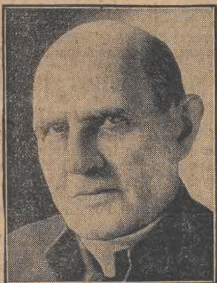
Arcybiskup San Francisco, ks. Edward Hanna, mianowany został dekretem papieskim kardynałem Stanów Zjednoczonych.