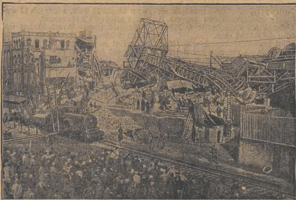
Zawalona wieża szybu, pod którą znaleźli śmierć robotnicy.