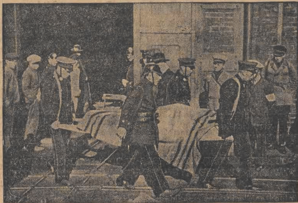
Pogrzeb dotychczas wydobytych ofiar straszliwej katastrofy.