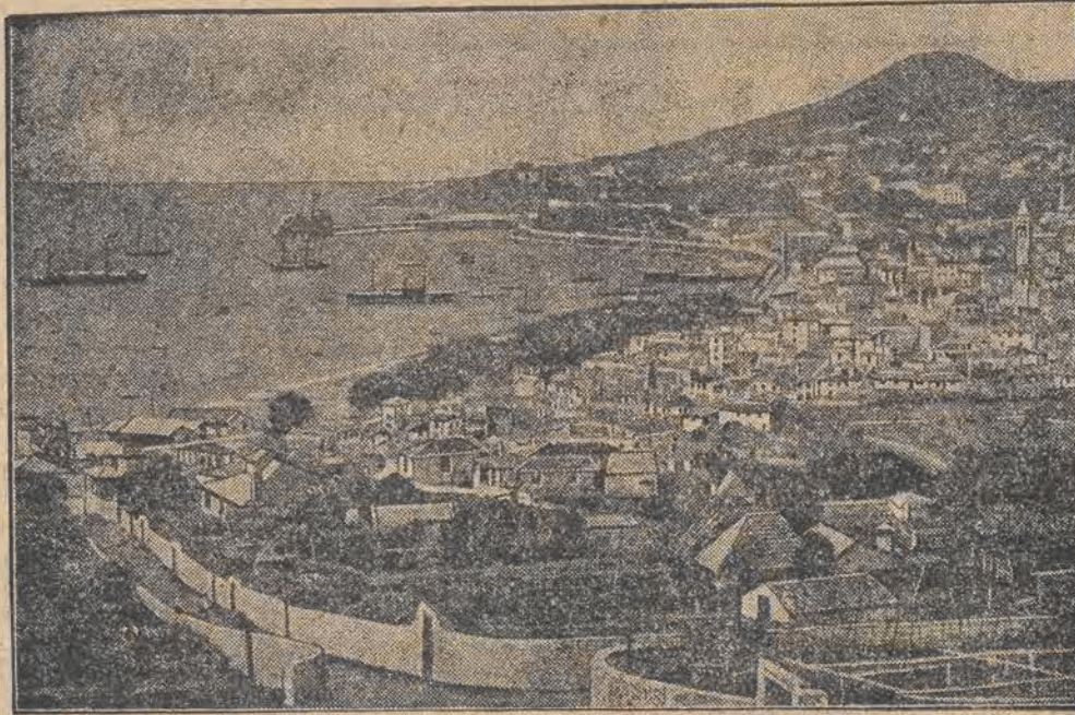
Ogólny widok miasta Funchal na Maderze, gdzie spędza swój urlop Marszałek Piłsudski.