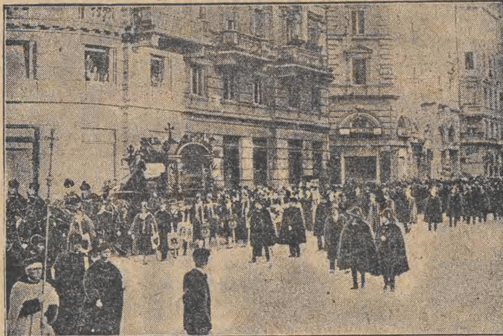
Pogrzeb prezydenta akademii włoskiej b. prezydenta senatu i b. ministra spraw zagranicznych Włoch, Tiltoni'ego, odbył się bardzo uroczysto w Rzymie