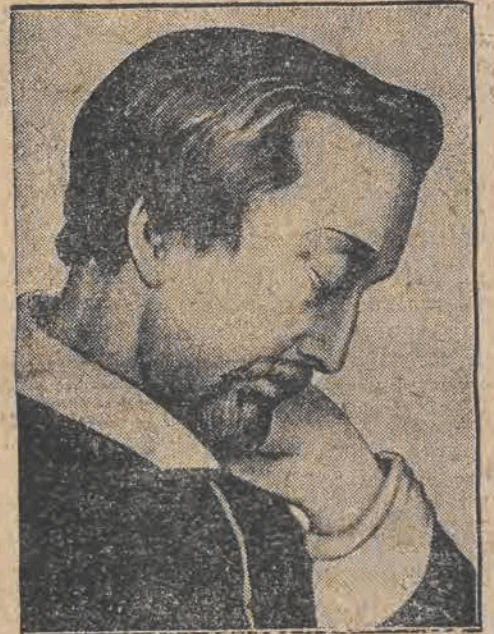
W dniu 17 lutego 1856 roku zmarł jeden z najwybitniejszych poetów niemieckich Henryk Heine. Cały świat kulturalny obchodzi obecnie rocznicę jego zgonu.