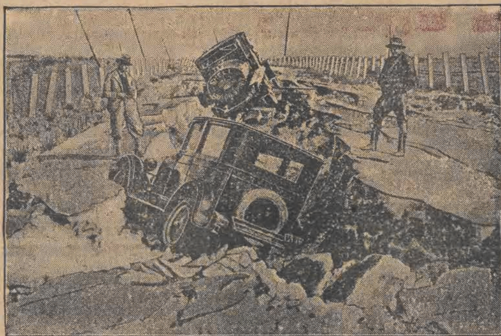
Trzesienie ziemi, które nawiedziło ostatnio Nową Zelandję, pozostawiło straszny obraz zniszczenia. Na ulicach i szosach powstały ogromne wyrwy, uniemożliwiające całkowicie wszelką komunikację.