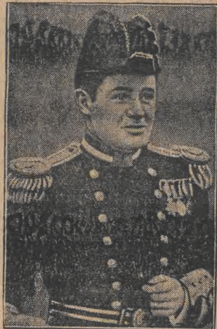
GLEN KIDSTON, popularny w angielskich sferach sportowych milioner ustanowił nowy rekord, przebywając trasę powietrzną na przestrzeni Londyn — Kapstadt w ciągu 6 dni.