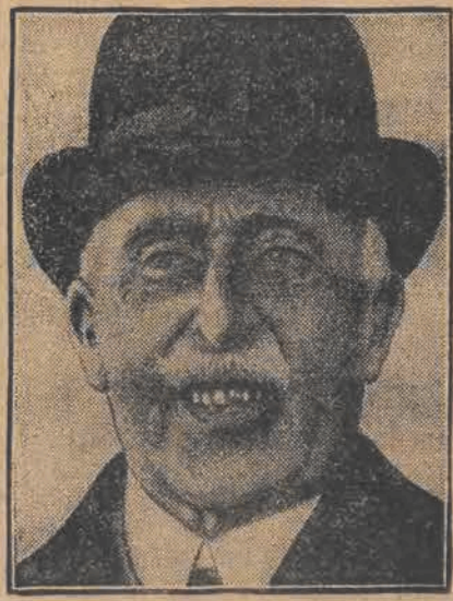
Książę Connaught, wuj króla angielskiego Jerzego, zmarł w tych dniach w wieku 81 lat.