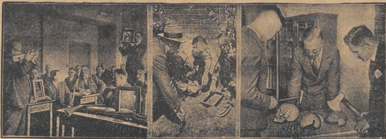
W Berlinie otwarto, pod protektoratem ministerstwa spraw wewnętrznych, policyjny instytut, w którym szkoleni będą urzędnicy policji kryminalnej. Na ilustracji — kilka scenek z pracy nowego instytutu.