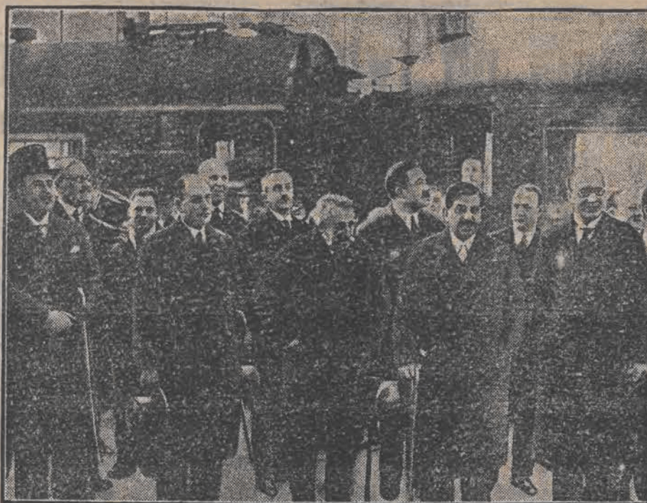
Ministrowie francuscy Laval i Briand opuścili już Berlin, udając się do Paryża. Ilustracja nasza przedstawia moment odjazdu ministrów z dworca centralnego w Berlinie.