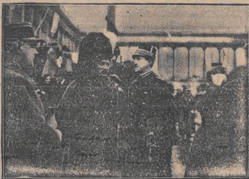
Zdjęcie przedstawia grupę attache wojskowych przy rządzie Rzeczypospolitej, obecnych na defiladzie w Warszawie. Zwraca wśród nich uwagę attache angielski w pióropuszu highlanderskim.