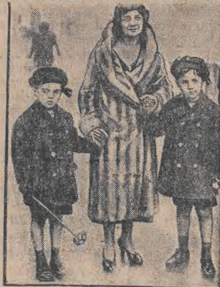
Znakomity aktor filmowy Charlie Chaplin ma dwóch synów, którzy kształcą się w Paryżu, pod opieką babki i prababki. Dzieci te, mimo swego wieku, już zdradzają niezwykły talent mimiczny.