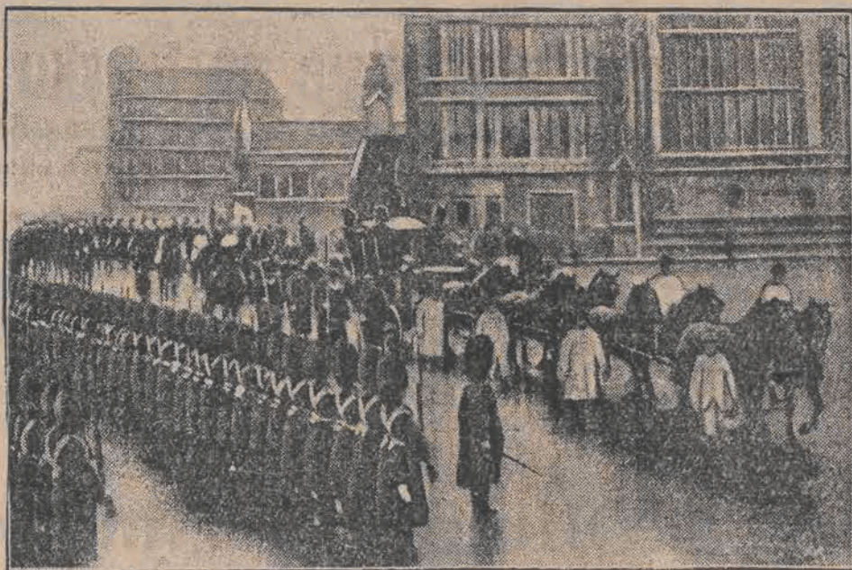
Parlament angielski otwarty został według tradycyjnego ceremonjału. Oddziały gwardji powitały przed gmachem parlamentu przybywającego króla.