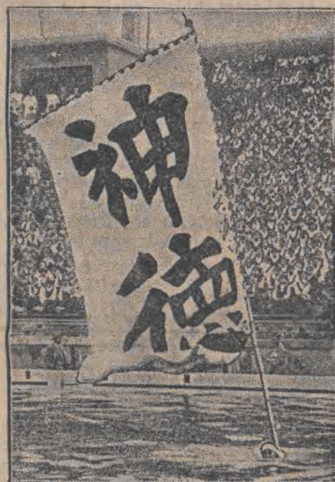
W Tokio, w olbrzymim basenie, zorganizowano wielkie zawody pływackie, połączone z wykazaniem sprawności pływaków. Ilustracja nasza wskazuje t. zw. pływanie choragwiami, polegające na tym, iż na piecach pływaka uwiązana jest olbrzymia, ciężka flaga.