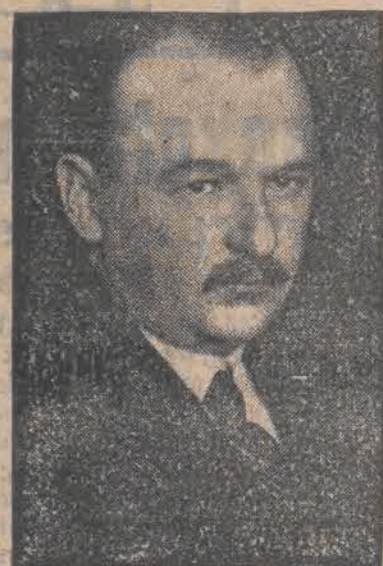
Pułk. Kazimierz Stamirowski.