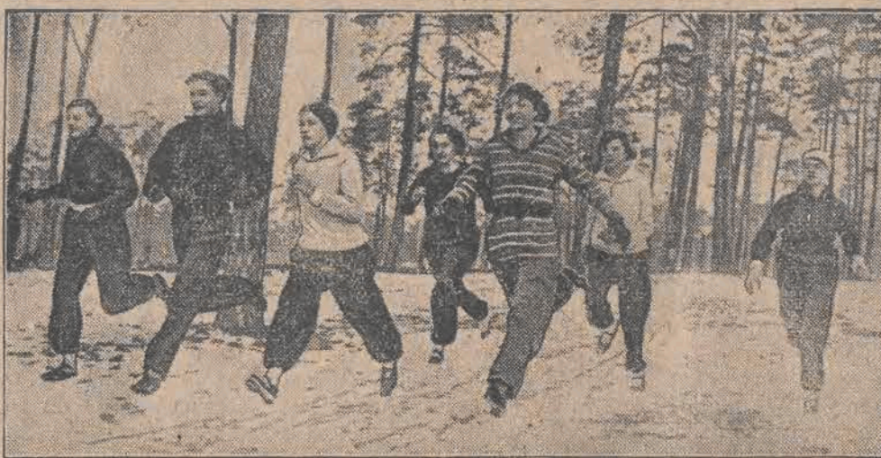
W St. Moritz odbyły się wielkie zawody sportowe, na czoło których wybił się bieg na przelaj dla pań. Bieg ten dał bardzo efektowne rezultaty.

SYSTEMATYCZNA WALKA Z GRUŻLICĄ MOŻE WYKORZENIĆ TE STRAZNĄ PLAGĘ LUDZKOŚCI !!! KUP NALEPKĘ PRZECIWGRUŻLICZĄ !!!