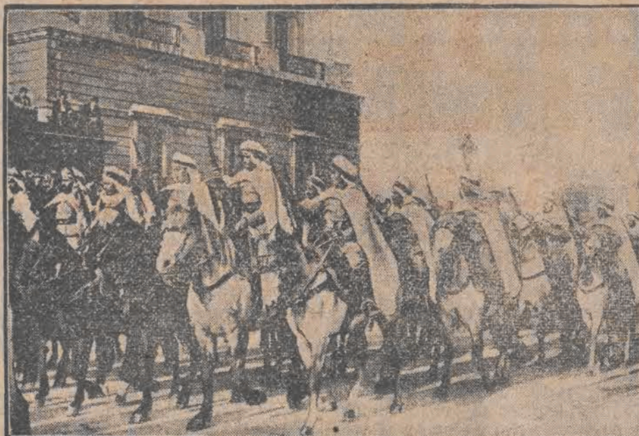
Po uroczystym zaprzysiężeniu, pierwszy prezydent republiki hiszpańskiej Zamorra, przyjął wielką rewję wojsk. W czasie rewji specjalną uwagę zwracały oddziały afrykańskie, z Marokka hiszpańskiego.