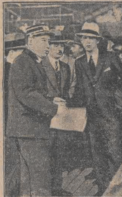
Jeden z królów amerykańskiego świata podziemnego, Jack Diamond, zamordowany został na ulicach New Yorku. Zdjęcie nasze przedstawia Diamonda na kilkanaście minut przed śmiercią. Zmachu dokonał niewątpliwie jeden z członków bandy Al Capone.