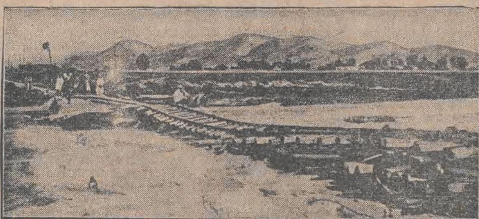
Północna Afryka została nawiedzona klęską powodzi. Cały Tunis zalany jest wodą. Zdjęcie nasze przedstawia widok linii kolejowej. Biserta, szyny musiano umieścić prowizorycznie na palach, aby zapobiec przerwie komunikacji.